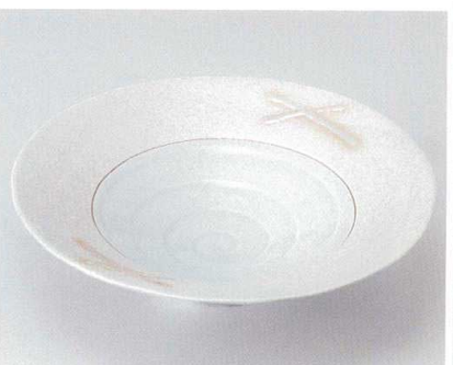
111-303-050 3,300円 ラスター曙丸皿(22.7×5.7) 510530205