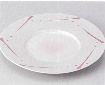
111-301-340 3,350円 ラスターピンクトバシリム付27cm皿(27.5×3) 809620134