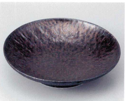
111-302-050 2,450円 金結晶とちり8.0深皿(24×5.5) 810440105