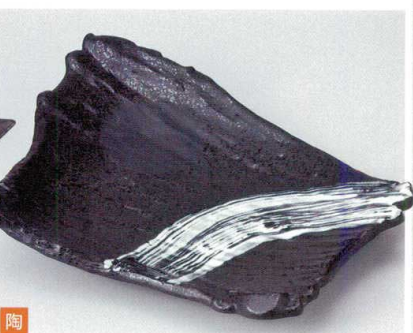
111-402-340 2,970円 金結晶フレイム皿(23.5×23.5×2) 1011140234