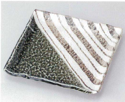
111-201-700 2,980円 織部ストライプ8.0正角皿(21.6×21.6×2.5) 520440377