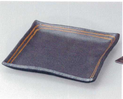
111-401-470 3,000円 黒ライン7.0正角皿(20.5×20×2.8) 510450447