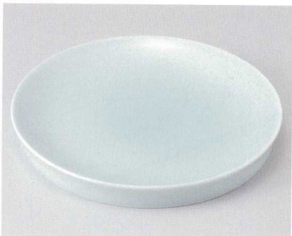
111-103-340 3,800円 青白磁8.0ハイプレート(24.5×3) 520340234 111-104-340 2,300円 青白磁6.5ハイプレート(19.6×2.3) 510850134