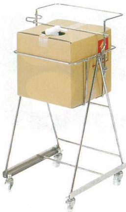
4 スチール缶スタンド 浅型ダンボール用 KC-10 キャスター付 〈BKV-74〉目 7-1456-0401 ¥28,000 470×420×H805(水平510) キャスター:ナイロン製 φ50×4自在 2輪スッパ付(対角)