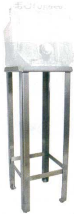
1 ステンレス製 BIC用スタンド ハイタイプ SHBIC No.20 〈BST-57〉目 7-1456-0101 ¥53,000 317×317×H843 ●アジャスター付 ※写真のバッグインコンテナは別売りです。