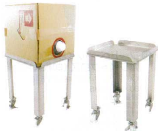
7 ステンレス製 バッグインボックス用スタンド 〈BST-60〉目 7-1456-0701 S No.20FC ¥26,000 317×317×H388 7-1456-0702 S No.10 ¥25,000 271×271×H388 キャスター:ナイロン製 φ50×4自在 2輪スッパ付