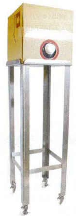
6 ステンレス製 バッグインボックス用スタンド ハイタイプ SHBIB No.20K 〈BST-58〉目 7-1456-0601 ¥55,000 317×317×H907 キャスター:ナイロン製 φ50×4自在 2輪スッパ付