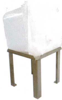
2 ステンレス製 BIC用スタンド SBIC No.20 〈BST-59〉目 7-1456-0201 ¥24,000 317×317×H325 ●アジャスター付 ※写真のバッグインコンテナは別売りです。