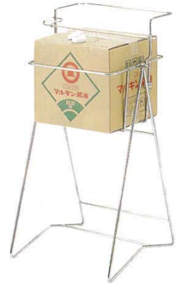
3 スチール缶スタンド 浅型ダンボール用 KC-10 〈BKV-73〉目 7-1456-0301 ¥21,000 470×420×H805(水平525) 有効内寸:305×325×H295