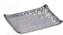
14 プラ容器 筑後 春秋黒 (10枚入) (XNS-02)