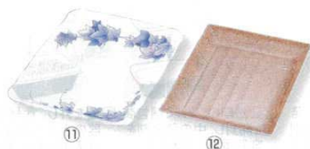
11 プラ容器 デリカバット ぶどう (10枚入) (XNS-14)