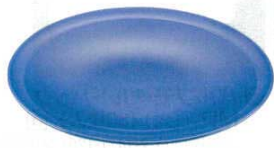
8 プラ容器 高台皿 紺 (5枚入) (XNS-16)

プラスチック 高台皿…各種盛り合わせはもちろん、焼鳥、天ぷら、おにぎり等スーパーのお惣菜陳列用バットとしてもご使用できます。