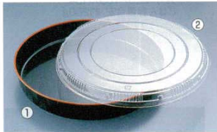
1 プラ容器 市松 黒赤フチ (XNS-05)