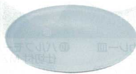
9 プラ容器 高台皿 青磁 (5枚入) (XNS-17)