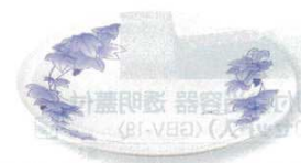
10 プラ容器 高台皿 ぶどう (5枚入) (XNS-18)