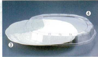
3 プラ容器 シルキー アイボリー (10枚入) (XNS-03)