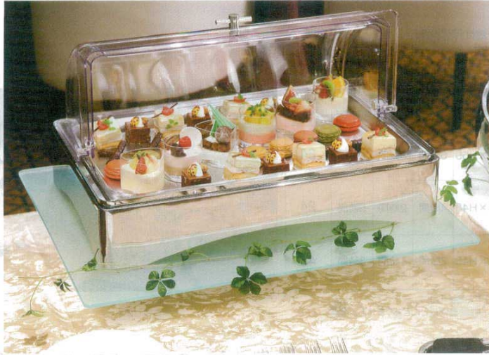
保冷剤を使用する「コールドタイプ」