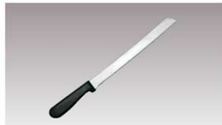
⑭黒柄 パン切ナイフ