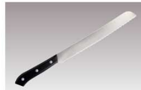
⑮ニューエーデルワイス パン切庖丁 NO180