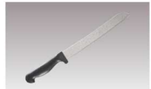
⑯黒柄 パン切ナイフ 30891