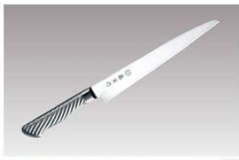
⑨藤寅作 パンスライサー