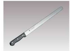
④グランドシェフ ウェーブナイフ