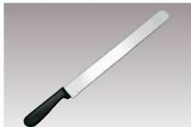
⑬ウェーブ パン切ナイフ

材質:刃部/ステンレスモリブデン鋼 ハンドル/エラストマー樹脂 鞘/天然木 ※ダンボール・ペットボトル等を切ることができ、キッチンナイフ、パン・カステラ切にもご使用できます。