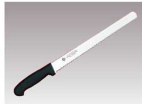
③グランドシェフ PC柄ウェーブナイフ