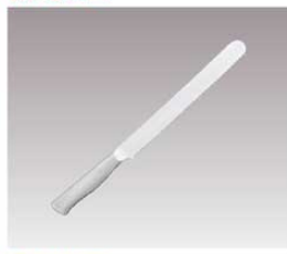
⑩柳宗理 ブレッドナイフ