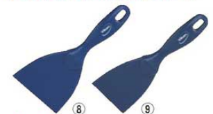
ヴァイカン MDS ハンドスクレーパー