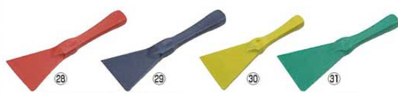
バーキンタ スパチュラ