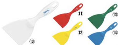
ヴァイカン ハンドスクレーパー 大 4061