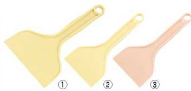
ホテイ印 ポリヘラ クリーム