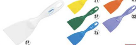
ヴァイカン ハンドスクレーパー 小 4060