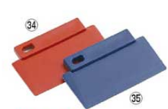
バーキンタ 3エッジスパチュラ

幅100×全長240 材質:ポリプロピレン(鉄粉配合) 耐熱温度:120℃ ●金属検出器で検出できる樹脂製のスパチュラです。