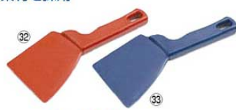
バーキンタ 2エッジスパチュラ

材質:ポリプロピレン(鉄粉配合) 耐熱温度:80℃ ●金属検出器で検出できる樹脂製のスパチュラです。