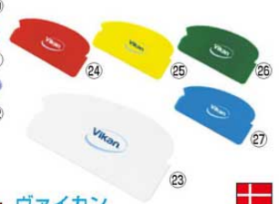
ヴァイカン オリジナルスクレーパー