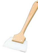
④ホテイ印 長柄 シリコン ゴムヘラ