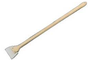
⑨ホテイ印 超長柄 ゴムヘラ