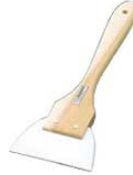
③長柄 シリコン ゴムヘラ