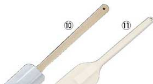
⑩木柄 シリコン ハンドクリーナー 特大