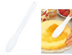
⑭フードヘラ (食瓶用ヘラ) No.161 ㊦