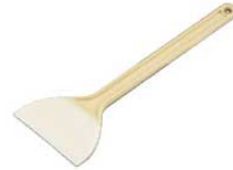
⑧ホテイ印 シリコンゴムヘラ L No.318