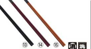
PBT 樹脂 面取角菜箸 30cm