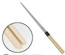
① 白木柄 盛箸 (水牛桂付)