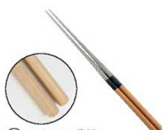
③ チタン 盛箸