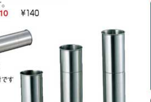
㉑ 18-8 菜箸スタンド

全長:300 材質:本体/ナイロン66樹脂(耐熱200℃) 先端/シリコン樹脂(耐熱300℃) ●先端がシリコン樹脂で焦げにくく、滑りにくい。