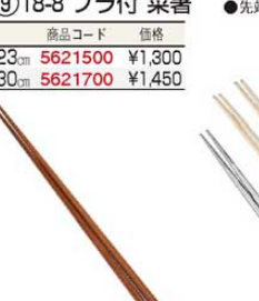
⑭ 銘木 菜箸 すべり止め付

全長:325 材質:樺の木料 真樺(マカンパ)の圧縮材(国産) ●圧縮材だから強くて丈夫! ●手元は刀彫にして持ち易く、箸先は筋を入れてすべり止にしてあります。