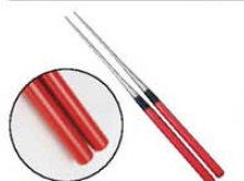
⑥ 塗り柄盛箸 朱

●木柄(杵)にウレタン系塗料を4層重ね塗りした柄で、色鮮やかで光沢があり手にしっとりなじみます。