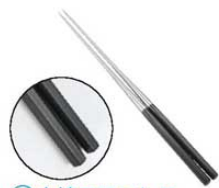
② 本焼ステンレス 黒合板六角柄盛箸