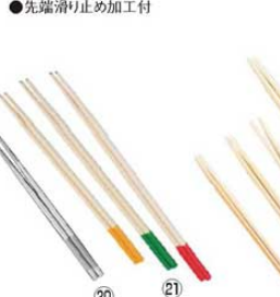
⑮ 18-8 取り箸