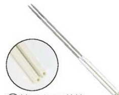
④ 純チタン 菜箸

白木丸柄水牛桂 ●純チタン材を使用なので錆に強い。ステンレスよりもはるかに軽くて手がかかりません。