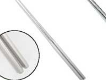
⑦ 本焼ステンレス六角柄盛箸

●木柄(杵)にウレタン系塗料を4層重ね塗りした柄で、色鮮やかで光沢があり手にしっとりなじみます。