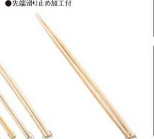
⑯ EBM 竹 菜箸