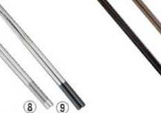
⑧ 18-8 菜箸