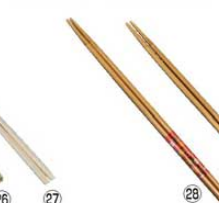
⑱ 青竹製 菜箸