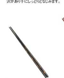
⑬ 積層 細身取箸 墨味