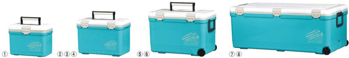
① ② ③ ④ ⑤ ⑥ ⑦ ⑧