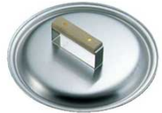
④ステンレス ギョーザ鍋用蓋