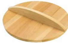
③EBM さわら 木蓋 (ギョーザ鍋用蓋兼用)