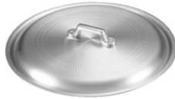
②アルミ ギョーザ鍋用蓋

※餃子鍋の板厚が厚いのは、熱が均一に伝わり熱効率にすぐれ、ムラなく焼きあがるためです。