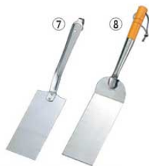
⑦UK 18-8 ギョーザ返し