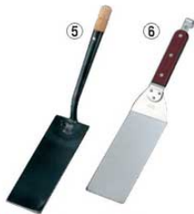
⑤EBM 鉄 ギョーザ返し