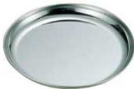
⑲EBM 18-0 給食皿

外寸:幅460×長さ750 0210500 ¥2,800 目開き:0.45mm ●野菜の水切りにも使用すると便利です。