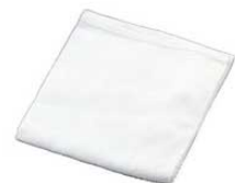
⑱ナイロン ギョーザ絞り袋

外寸:幅460×長さ750 0210500 ¥2,800 目開き:0.45mm ●野菜の水切りにも使用すると便利です。