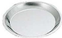
⑳FK プリキ パイ皿