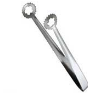
⑪ステンレス ロング天プラトング 3586900 ¥500 全長:300