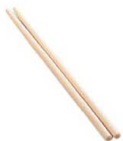
⑲粉箸 0241100 ¥540 全長360