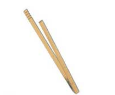
⑬竹 天ぷらバサミ 全長 商品コード 価格 大 400 5851900 ¥1,100 小 300 5852000 ¥900