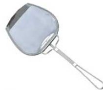
⑧18-8 プレス式 角型 カス揚