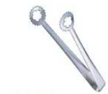
⑩EBM ステンレス 天プラトング 0706100 ¥400 全長:235