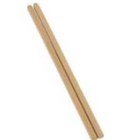
⑳カバ材(国産) 天ぷら粉とき箸 商品コード 価格 30cm 8487700 ¥1,400 33cm 8487800 ¥1,700 36cm 8487900 ¥2,000 ●カバ材を使用している為反りもなく耐久性に優れています。