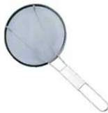
⑥ステンレス 平測 丸型 カス揚