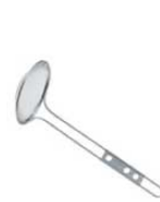
⑦TS 18-8 mini 丸型 カス揚

●金網端を板金で巻き締めし、中に全周芯金を入れてありますので、使用中に網が切れたり外れたりしにくい構造になっています。