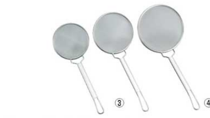
③フジボシ18-8 強力丸カス揚