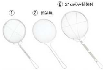
①EBM 18-8 手アミ式 丸型 カス揚