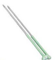
⑱ステンレス 温度計付 揚箸 天ぷらメーター 切 0240800 ¥3,800 50℃~200℃ 全長350