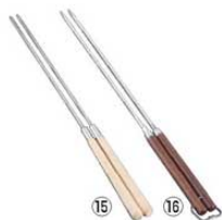
⑮木柄 揚箸 全長 商品コード 価格 大 420 0240300 ¥720 小 350 0240400 ¥700