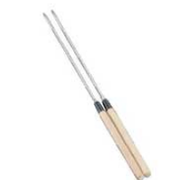
⑭天然木 天ぷら揚箸 全長 商品コード 価格 大 420 0240100 ¥1,350 小 350 0240200 ¥1,150