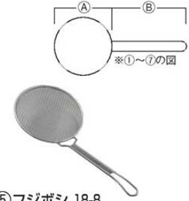
⑤フジボシ 18-8 丸型フライ揚 4メッシュ