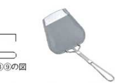
⑨18-8 手アミ式 角型 カス揚