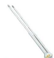
⑰アルミ 温度計付 揚箸 天ぷらメーター 切 0240700 ¥1,800 100℃~200℃ 全長350