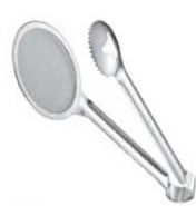
⑫UK 18-8 フライトング 4364000 ¥2,100 全長:280