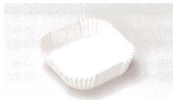
1 M34-112 14×14 1,500枚入 縦85×横85×高27