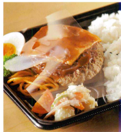
4 M34-107 640円 (1枚単価0.64円) 10角 1,000枚入 縦10×横10