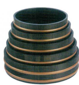
天然木盛込桶黒色 目皿付