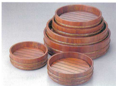
強化バンド摺漆桶 目皿付