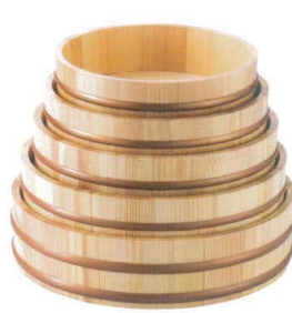
天然木盛込桶クリアー 目皿付