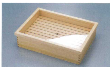
ネタ箱・かぶせ蓋/目皿 ステンレスバット付