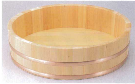
楕・大半切 (銅タガ・底竹補強付)