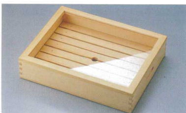
ネタ箱 目皿・アクリル蓋付