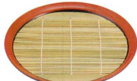
⑨ 名月そば皿 黒測朱 1-537-6 A|本体 ¥1,200 (22.8φ×2.6) 梱80 1-536-1B 竹竹ス(19.5φ)1枚 ¥380 (19.5φ)