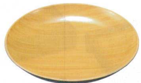
⑰ 24cm多用皿 白木塗 S-8-19 A|本体 ¥1,500 (24.3φ×4) 梱60 1-536-1B 竹竹ス(19.5φ)1枚 ¥380 (19.5φ)