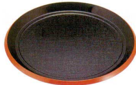
① 8寸丸布目そば皿 黒測朱 1-537-3 A|本体 ¥750 (23.5φ×3) 梱80 1-536-1B 竹竹ス(19.5φ)1枚 ¥380 (19.5φ) S-10-50 P.P.P.淵付クリーム竹ス(19.5φ)丸 ¥400 (19.5φ)