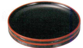
⑪ 樽型そば皿 朱帯黒(底板付) S-9-70 A|本体 ¥1,700 (21.2φ×3.4) 1-536-1B 竹竹ス(19.5φ)1枚 ¥380 (19.5φ)