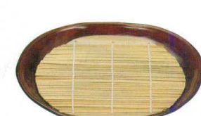
⑮ 白山そば皿 板 S-7-43 A|本体 ¥1,000 (24.3×22.7×3.4) 梱80 1-536-1B 竹竹ス(19.5φ)1枚 ¥380 (19.5φ)