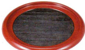
④ 8寸丸刷毛目そば皿 赤溜春慶 S-10-79 A|本体 ¥1,400 (23.5φ×3) 梱80 1-536-1B 竹竹ス(19.5φ)1枚 ¥380 (19.5φ)