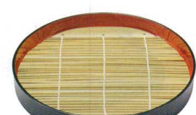
⑬ 7寸涼風丸ザル 黒木目内朱 S-8-17 A|本体 ¥850 (20.7φ×3) 梱80 1-536-1B 竹竹ス(19.5φ)1枚 ¥380 (19.5φ)