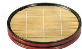
⑩ 樽型そば皿 黒帯朱(底板付) S-9-69 A|本体 ¥1,700 (21.2φ×3.4) 1-536-1B 竹竹ス(19.5φ)1枚 ¥380 (19.5φ)