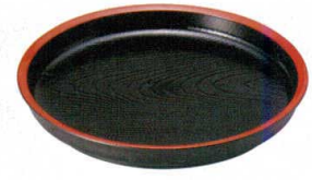
③ 7.5寸羽反そば皿 黒木目天朱 S-9-44 A|本体 ¥850 (22.2φ×3) 1-536-1B 竹竹ス(19.5φ)1枚 ¥380 (19.5φ)