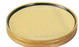
⑫ 樽型そば皿 白木帯金(底板付) S-9-71 A|本体 ¥2,050 (21.2φ×3.4) S-10-50 P.P.P.淵付クリーム竹ス 19.6φ 丸 ¥400 (19.6φ)