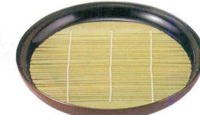
⑲ 7.5寸寿ザル 溜カスリ内黒 S-7-42 A|本体 ¥1,700 (22.7φ×3.5) 梱80 1-536-1B 竹竹ス(19.5φ)1枚 ¥380 (19.5φ)