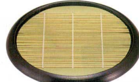
⑥ 8寸丸刷毛目そば皿 黒 1-537-2 A|本体 ¥750 (23.5φ×3) 梱80 1-536-1B 竹竹ス(19.5φ)1枚 ¥380 (19.5φ)