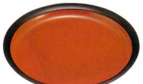
⑧ 名月そば皿 朱測黒 1-537-5 A|本体 ¥1,200 (22.8φ×2.6) 梱80 1-536-1B 竹竹ス(19.5φ)1枚 ¥380 (19.5φ)