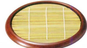
⑦ 8寸丸刷毛目そば皿 板塗(底板付) S-9-66 A|本体 ¥1,000 (23.5φ×3) 1-536-1B 竹竹ス(19.5φ)1枚 ¥380 (19.5φ)