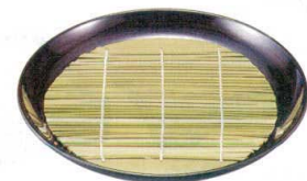
⑱ 24cm多用皿 茶刷毛目底黒塗 S-8-20 A|本体 ¥1,800 (24.3φ×4) 梱60 1-536-1B 竹竹ス(19.5φ)1枚 ¥380 (19.5φ)