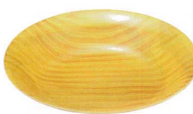
⑯ 7寸羽反丸そば皿 白木(ミニそば用) S-8-18 A|本体 ¥1,000 (21.4φ×4) 梱80 S-7-25A 竹竹ス(15φ)1枚 ¥380 (15φ)