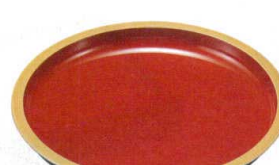
⑭ 大盛測太そば皿 朱天白木 S-8-21 A|本体 ¥900 (25.2φ×3.2) 梱60 1-536-1B 竹竹ス(19.5φ)1枚 ¥380 (19.5φ)