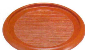
⑤ 8寸丸刷毛目そば皿 朱 1-537-1 A|本体 ¥750 (23.5φ×3) 梱80 1-536-1B 竹竹ス(19.5φ)1枚 ¥380 (19.5φ)