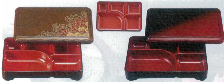
6-1027-1 ¥2,600 8.5寸 長手弁当 梨地野菊内朱 [A] 255×172×55 5-859-1 (23212560)