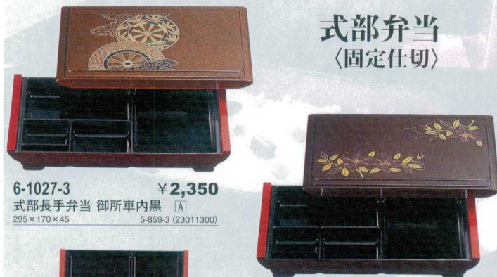
6-1027-3 ¥2,350 式部長手弁当 御所車内黒 [A] 295×170×45 5-859-3 (23011300)