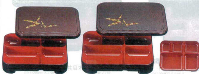
6-1027-5 ¥2,500 8寸 長手胴張弁当 パール笹梅内朱 [A] 240×190×50 5-859-5 (23021450)