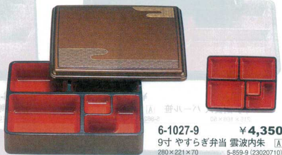
6-1027-9 ¥4,350 9寸 やすらぎ弁当 雲波内朱 [A] 280×221×70 5-859-9 (23020710)