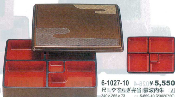
6-1027-10 ¥5,550 尺1 やすらぎ弁当 雲波内朱 [A] 340×265×73 5-859-10 (23020720)