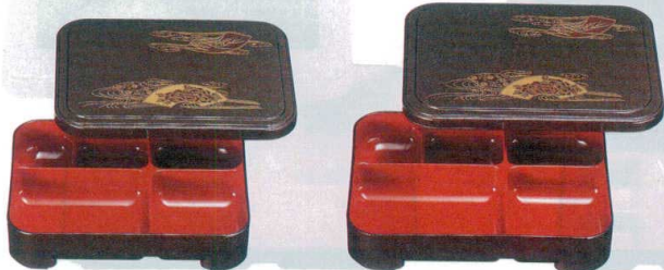
6-1027-7 ¥2,600 8寸 長手胴張弁当 扇面菊水内朱 [A] 240×190×50 5-859-7 (23021430)