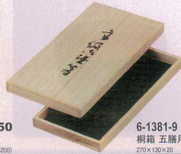
6-1381-9 ¥1,200 桐箱 五膳用 台紙付 270×130×20 5-1172-9(90023210)