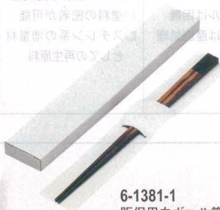
6-1381-1 ¥80 販促用白ボール箱 242×42×14 5-1172-1(90031426)