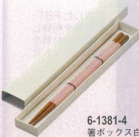
6-1381-4 ¥400 箸ボックス白(一膳用) 242×37×19 5-1172-4(90033379)