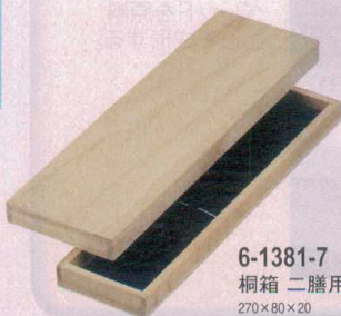
6-1381-7 ¥950 桐箱 二膳用 無地 台紙付 270×80×20 5-1172-7(90023190)