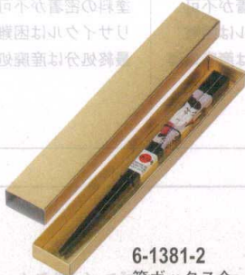
6-1381-2 ¥400 箸ボックス金 一膳用 242×37×19 5-1172-2(90034527)