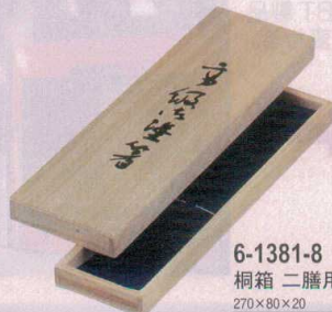
6-1381-8 ¥950 桐箱 二膳用 台紙付 270×80×20 5-1172-8(90023200)