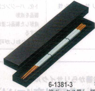
6-1381-3 ¥550 箸ボックス黒(一膳用) 250×40×19 5-1172-3(90031424)