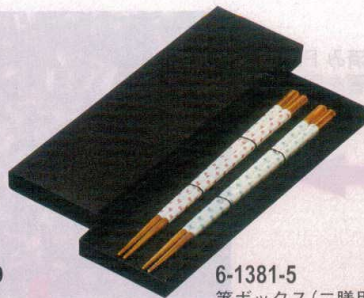
6-1381-5 ¥700 箸ボックス(二膳用) 250×80×19 5-1172-5(90031425)