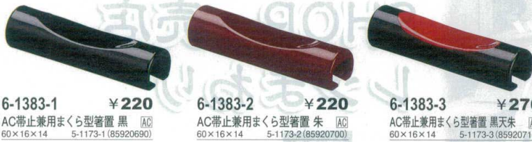
6-1383-1 ¥220 AC帯止兼用まくら型箸置 黒 [AC] 60×16×14 5-1173-1(85920690)