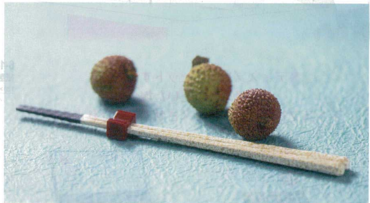
6-1383-8 ¥250 くぼみ型箸カバー兼用箸置 [A] 黒刷毛目 67×17×12 5-1173-5(12035425)