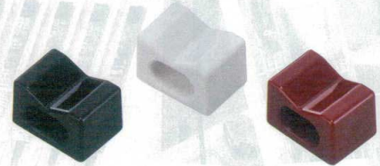
ACミニブリッジ箸止&箸置き [AC] 29×13×12 6-1383-4 白OM ¥260 5-1173-4 (82158380) 6-1383-5 黒OM ¥260 5-1173-7 (82158360) 6-1383-6 朱OM ¥260 5-1173-8 (82158370)