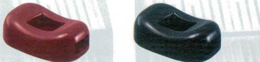
6-1383-20 ¥350 ビーズ箸止兼用箸置 朱 [AC] 41×28×15 5-1173-12(60002440)