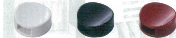
ACかんざし箸止&箸置き [AC] φ27×13 6-1383-9 白OM ¥300 5-1173-9 (82158350)