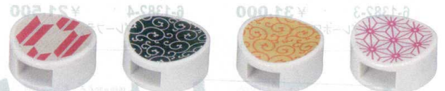
ACかんざし箸止&箸置き [AC] φ27×13