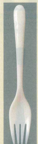
6-1393-8 ¥800 テーブルフォーク 白OM 180×29 5-1191-8 (82158190)