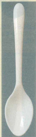
6-1393-2 ¥800 テーブルスプーン 白OM 180×39 5-1191-2 (82158188)