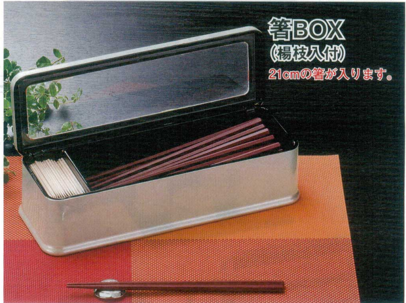
箸BOX (楊枝入付) 21cmの箸が入ります。