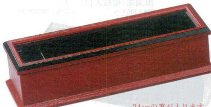
24cmの箸が入ります。 6-1427-8 ¥3,800 朱瀾黒(楊枝入付) [A] 320×105×80 5-1209-9(81258272) (クリーンフード別途)