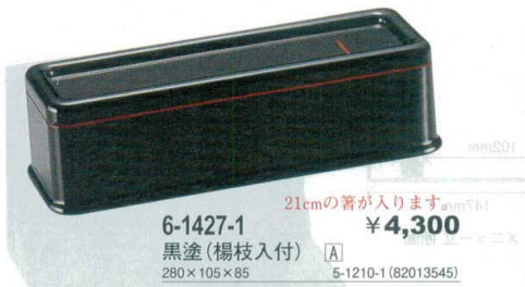
21cmの箸が入ります。 6-1427-1 ¥4,300 黒塗(楊枝入付) [A] 280×105×85 5-1210-1(82013545)