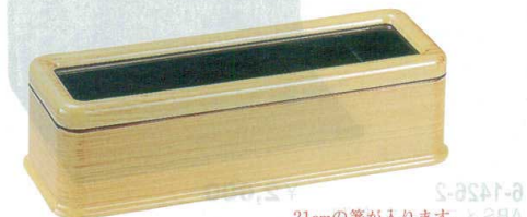
21cmの箸が入ります。 6-1427-3 ¥4,300 白木刷毛目塗(楊枝入付) [A] 280×105×85 5-1210-3(82013560)