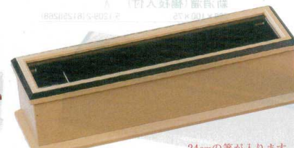
24cmの箸が入ります。 6-1427-9 ¥3,800 白木瀾黒(楊枝入付) [A] 320×105×80 5-1209-10(81258273) (クリーンフード別途)