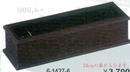
24cmの箸が入ります。 6-1427-6 ¥3,700 新消溜(楊枝入付) [A] 320×105×80 5-1209-8(82296640) (クリーンフード別途)