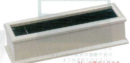
24cmの箸が入ります。 6-1427-10 ¥4,950 シルバー(楊枝入付) [A] 320×105×80 5-1209-11(82158274) (クリーンフード別途)