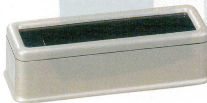
21cmの箸が入ります。 6-1427-4 ¥4,950 シルバー(楊枝入付) [A] 280×105×85 5-1210-4(81258270)