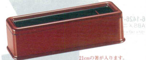
21cmの箸が入ります。 6-1427-2 ¥4,300 朱塗(楊枝入付) [A] 280×105×85 5-1210-2(75002430)