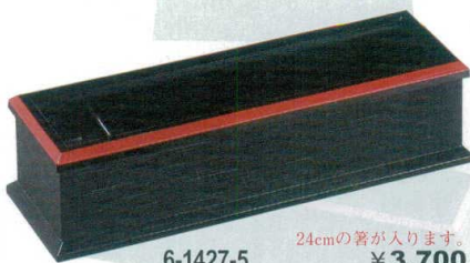
24cmの箸が入ります。 6-1427-5 ¥3,700 黒瀾朱(楊枝入付) [A] 320×105×80 5-1209-7(82296630) (クリーンフード別途)