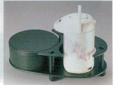
6-1493-21 ¥31,500 オーバルポットワゴン グリーンタキ 困 650×360×215 ポット穴径: φ230 5-1274-21 (81283450)