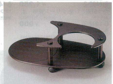
6-1493-22 ¥31,500 オーバルポットワゴン ブラウンタキ 困 650×360×215 ポット穴径: φ230 5-1274-22 (82253330)