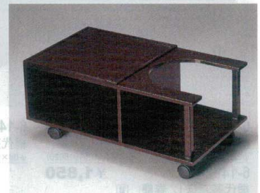
6-1493-23 ¥41,000 スクエアポットワゴン ブラウン目はじき 困 600×350×267 ポット穴径: φ220 5-1274-23 (82253340)