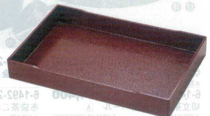
6-1493-25 ¥11,000 60cm 木製衣裳盆 ウルミ 困 内寸580×370×68 5-1274-25 (75003340)