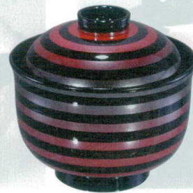
6-215-6 ¥3,050 耐熱3.3寸ゆり型小吸椀 朱銀彩口クロ TA 5-209-6 (15158330)