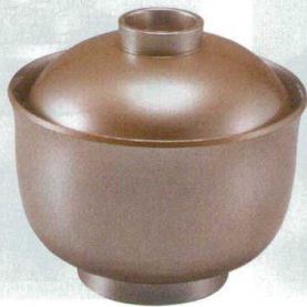
6-215-4 ¥2,700 耐熱3.3寸ゆり型小吸椀 総銀透き(琳) TA (33710520)