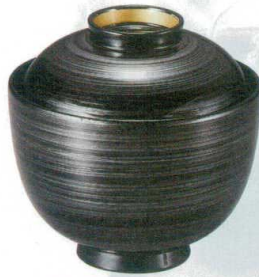
6-215-12 ¥3,050 耐熱室町小吸椀 銀湯ライン高台内金 TA 5-209-12 (37001420)