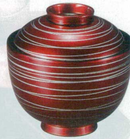
6-215-14 ¥3,050 耐熱室町小吸椀 ワインカラー乱 TA 5-209-14 (37001390)