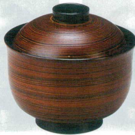
6-215-5 ¥2,100 耐熱3.3寸ゆり型小吸椀 茶刷毛目 TA 5-209-5 (12024000)