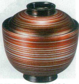
6-215-11 ¥2,750 耐熱室町小吸椀 黄金ライン TA 5-209-11 (37001410)