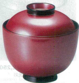
6-215-7 ¥1,950 耐熱室町小吸椀 朱銀染め TA 5-209-7 (12024010)