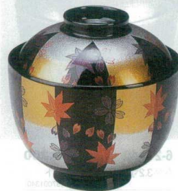
6-215-9 ¥2,950 耐熱室町小吸椀 金錦短冊 TA 5-209-9 (12024055)