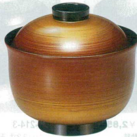
6-215-2 ¥2,300 耐熱3.3寸ゆり型小吸椀 朱金かすみ TA 5-209-2 (33600890)