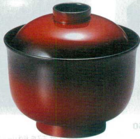
6-215-1 ¥1,800 耐熱3.3寸ゆり型小吸椀 夕焼け TA 5-209-1 (12023990)