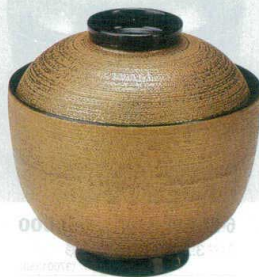
6-215-8 ¥1,900 耐熱室町小吸椀 乾漆金刷毛目 TA 5-209-8 (12024020)