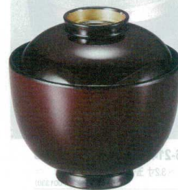
6-215-10 ¥1,900 耐熱室町小吸椀 溜高台内金 TA 5-209-10 (37001380)