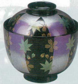
6-215-13 ¥2,950 耐熱室町小吸椀 紫錦短冊 TA 5-209-13 (12024065)