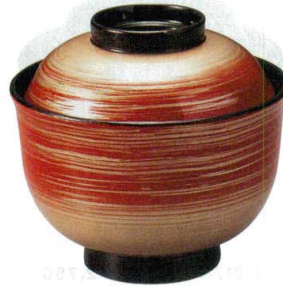
6-216-5 ¥2,450 耐熱都羽反小吸椀 銀朱ぼかし TA 5-210-5 (12024110)