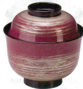
6-216-9 ¥2,400 耐熱3.3寸 羽反小吸椀 紫銀ぼかし TA 5-210-9 (12024115)