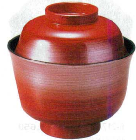
6-216-10 ¥2,600 耐熱3.3寸 羽反小吸椀 朱ライン銀かすみ TA 5-210-10 (12024125)