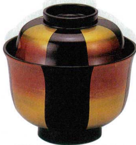
6-216-11 ¥3,600 耐熱3.3寸 羽反小吸椀 朱金市松 TA 5-210-11 (70000110)