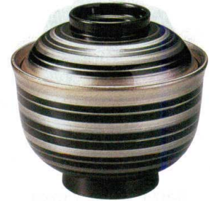
6-216-4 ¥3,550 耐熱都羽反小吸椀 銀独染 TA 5-210-4 (12024100)