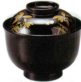
6-216-3 ¥2,900 耐熱都羽反小吸椀 黒匠 TA 5-210-3 (12024130)