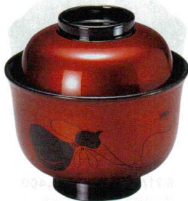
6-216-7 ¥2,200 耐熱3.3寸 羽反小吸椀 一分溜ひょうたん TA 5-210-7 (33600980)