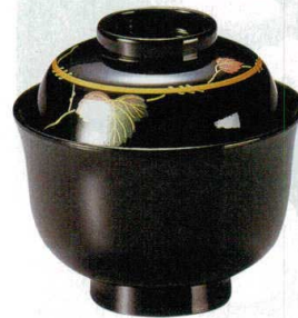
6-216-13 ¥4,000 耐熱3.3寸 羽反小吸椀 手描き黒葛 TA 5-210-13 (33101190)