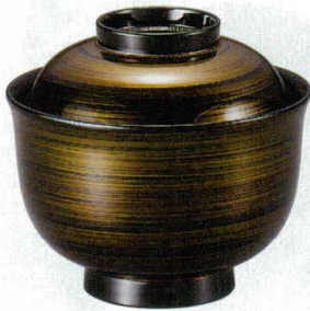
6-216-1 ¥3,150 耐熱都羽反小吸椀 黄金渦 TA 5-210-1 (37001440)