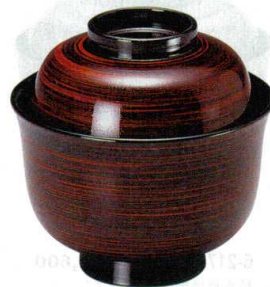
6-216-8 ¥2,300 耐熱3.3寸 羽反小吸椀 一分溜刷毛目 TA 5-210-8 (33600970)