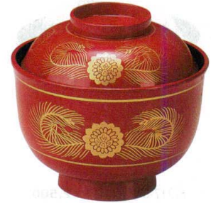
6-216-6 ¥3,300 耐熱都羽反小吸椀 朱金蘭 TA 5-210-6 (12024120)