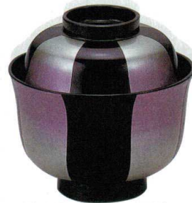
6-216-12 ¥3,600 耐熱3.3寸 羽反小吸椀 紫銀市松 TA 5-210-12 (70000120)