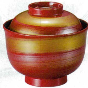
6-216-2 ¥3,150 耐熱都羽反小吸椀 朱一筆かすり TA 5-210-2 (37001450)