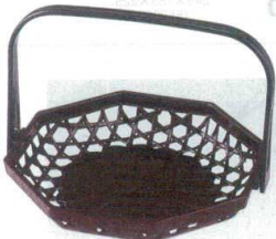
6-559-13 ¥1,050 八角菊手提籠 新溜 [A] 202×188×150 5-464-17 (51030946)