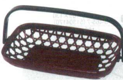
6-559-16 ¥980 6.5寸 長角手提籠 ウルミ [A] 207×137×103 5-464-12 (51204292)