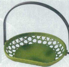
6-559-11 ¥1,800 6寸 半月手提籠 若竹 [A] 196×164×165 (55203790)