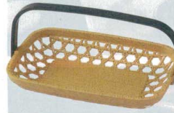
6-559-18 ¥2,000 6.5寸 長角手提籠 ゴマ竹 [A] 207×137×103 (55203815)