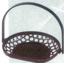
6-559-10 ¥1,100 6寸 半月手提籠 新溜 [A] 196×164×165 5-464-15 (51030945)