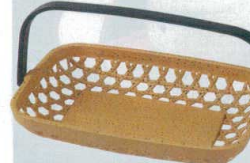
6-559-21 ¥2,350 8寸 長角手提籠 ゴマ竹 [A] 240×160×115 (55203825)