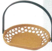
6-559-12 ¥1,800 6寸 半月手提籠 ゴマ竹 [A] 196×164×165 (55203792)