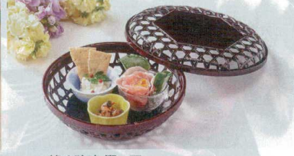
籠め珍味 溜 [A] 6-559-7 ¥780 φ104×47 5-464-1 (51300010)