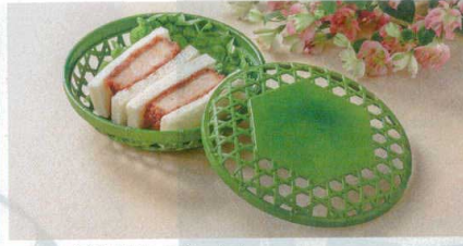
籠め珍味 若竹 [A] 6-559-4 ¥2,000 φ104×47 (51300016)