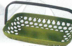
6-559-20 ¥2,350 8寸 長角手提籠 若竹 [A] 240×160×115 (55203820)