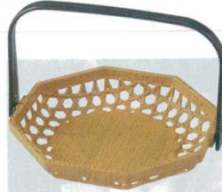
6-559-15 ¥2,150 八角菊手提籠 ゴマ竹 [A] 202×188×150 (55203805)