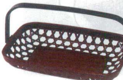
6-559-19 ¥1,450 8寸 長角手提籠 ウルミ [A] 240×160×115 5-464-14 (51074621)