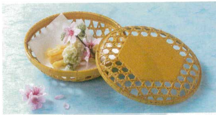
籠め珍味 ゴマ竹 [A] 6-559-1 ¥2,000 φ104×47 (51300013)