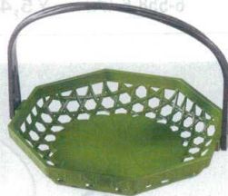
6-559-14 ¥2,150 八角菊手提籠 若竹 [A] 202×188×150 (55203800)