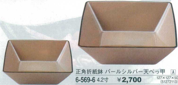
正角折紙鉢 パールシルバー天べつ甲 [A] 6-569-6 4.2寸 ¥2,700 127×127×50 (51272113) 6-569-7 6.0寸 ¥3,500 185×185×60 (51272114)