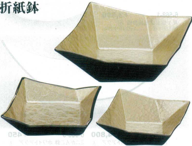
折紙鉢 イエローアクア塗 [A] 6-569-8 7.0寸(深) ¥3,800 210×200×76 5-473-1 (22031020) 6-569-9 5.2寸(浅) ¥3,300 165×160×50 5-473-2 (22031080) 6-569-10 4.7寸(深) ¥3,200 143×137×53 5-473-3 (22030960)