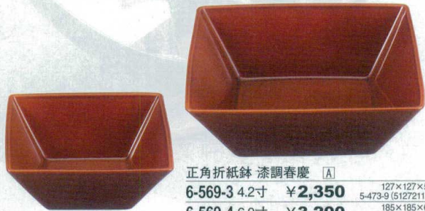
正角折紙鉢 漆調春慶 [A] 6-569-3 4.2寸 ¥2,350 127×127×50 5-473-9 (51272113) 6-569-4 6.0寸 ¥3,200 185×185×60 5-473-10 (51272114)