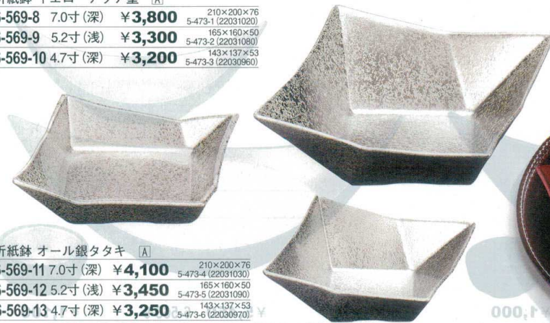
折紙鉢 オール銀タタキ [A] 6-569-11 7.0寸(深) ¥4,100 210×200×76 5-473-4 (22031030) 6-569-12 5.2寸(浅) ¥3,450 165×160×50 5-473-5 (22031090) 6-569-13 4.7寸(深) ¥3,250 143×137×53 5-473-6 (22030970)