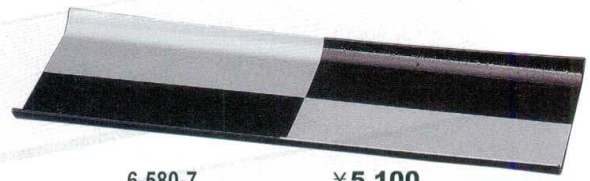
6-580-7 ¥5,100 (平底タイプ) 尺2 長手春日盛器 黒銀タキ市松 (TA) (51272134) 360×137×17 5-498-7