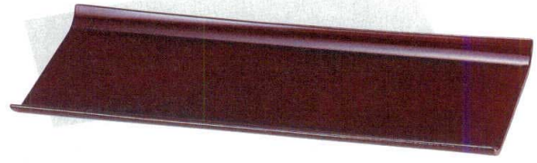
6-580-6 ¥3,300 (平底タイプ) 尺2 長手春日盛器 溜毘沙門天 (TA) (45015060) 360×137×17 5-498-6