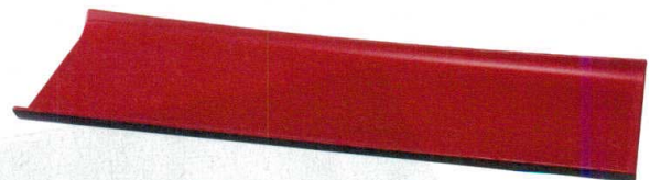
6-580-5 ¥2,400 (平底タイプ) 尺2 長手春日盛器 赤 二度塗 (TA) (55204070) 360×137×17