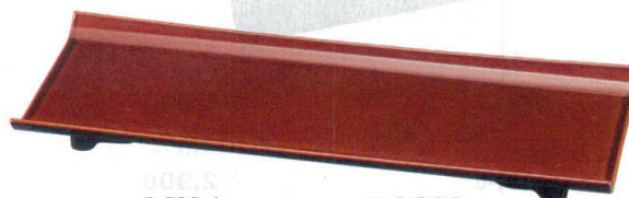
6-580-4 ¥4,900 (高足タイプ) 尺2 長手春日盛器 漆調春慶 (TA) (51272135) 360×137×32 (L型足付) 5-498-5