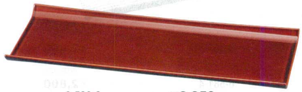
6-580-8 ¥3,950 (平底タイプ) 尺2 長手春日盛器 漆調春慶 (TA) (51272136) 360×137×17 5-498-8