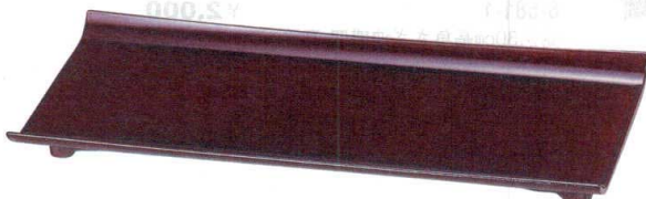
6-580-2 ¥4,350 (高足タイプ) 尺2 長手春日盛器 溜毘沙門天 (TA) (45015065) 360×137×32 (L型足付) 5-498-3