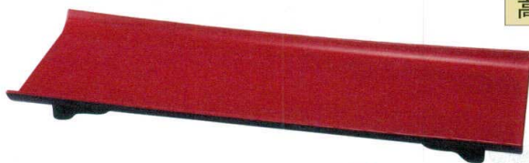
6-580-1 ¥3,300 (高足タイプ) 尺2 長手春日盛器 赤 二度塗 (TA) (55204075) 360×137×32 (L型足付)