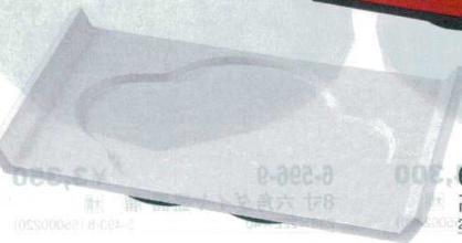
6-597-9 ¥2,200 高砂盛器(小) ホワイトアクア [A] 260×160×26 (55204215)