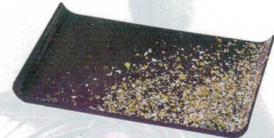
6-597-3 ¥5,300 平安盛皿 箔舞踊 [M] 228×153×30 (55204200)