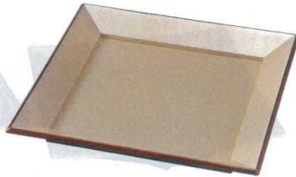
6-597-5 ¥2,300 7.8寸正角千筋四方盛皿 黄金銀影測べっ甲 [A] 235×235×26 (55204305)