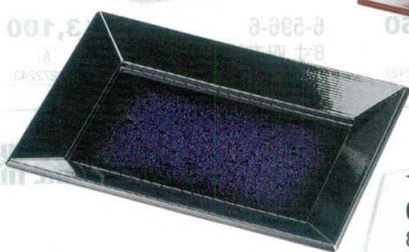
6-597-7 ¥2,600 8寸長角千筋四方盛皿 紫銀河塗 [A] 240×170×26 5-485-7 (55008080)