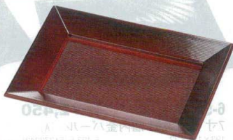
6-597-6 ¥1,600 8寸長角千筋四方盛皿 新溜 [A] 240×170×26 5-485-6 (51030845)