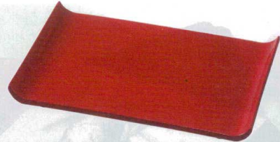
6-597-1 ¥2,500 平安盛皿 赤 二度塗 [M] 228×153×30 (55204195)