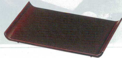
6-597-2 ¥4,000 平安盛皿 漆調溜 [M] 228×153×30 5-485-2 (51011690)