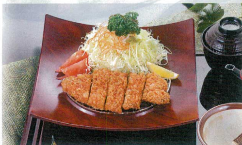
6-603-5 ¥4,200 8.5寸高台弥生鉢 チーク木目裏黒 [TA] 263×263×64 5-497-10 (45133560)