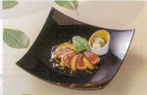
6-603-9 ¥3,700 8.5寸高台弥生鉢 油滴天目裏黒 [TA] 263×263×64 5-497-5 (45133530)