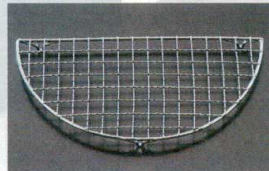
6-603-6 ¥1,500 ステンレス半月網 (小) [ST] 180×90×5 5-497-6 (90120950)