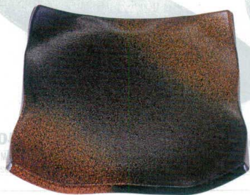
6-603-2 ¥2,600 7.5寸四方隅上がり盛皿 焼き締め [A] 223×223×40 5-497-2 (55011680)