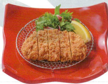
6-603-3 ¥2,200 7.5寸四方隅上がり盛皿 赤 二度塗 [A] 223×223×40 (46201210)