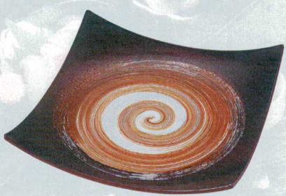
6-603-12 ¥4,100 8.5寸高台弥生鉢 溜うず裏黒 [TA] 263×263×64 5-497-11 (45133550)