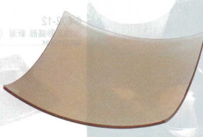
6-603-11 ¥3,900 8.5寸高台弥生鉢 黄金銀彩測べつ甲 [TA] 263×263×64 (55204275)