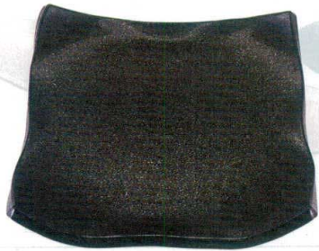
6-603-1 ¥2,200 7.5寸四方隅上がり盛皿 黒タタキ [A] 223×223×40 5-497-1 (55011670)