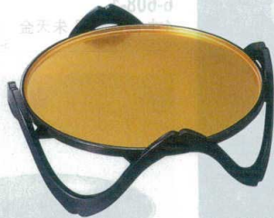
6-609-5 盆情盛器底板付 梅型皿 金粉蒔き [A] 皿 φ163×11 (55002205)