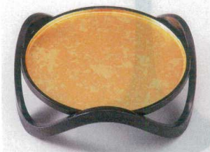
6-609-11 丸型盆情盛器 足付 二色金箔 [A] 5-507-10 (55204360)