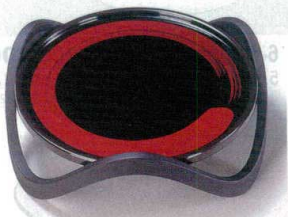
6-609-9 丸型盆情盛器 足付 黒に朱一筆 [A] 5-507-8 (51310136)

皿：φ164×12mm 足：φ175×71mm 足のみ ¥900 (51310231)