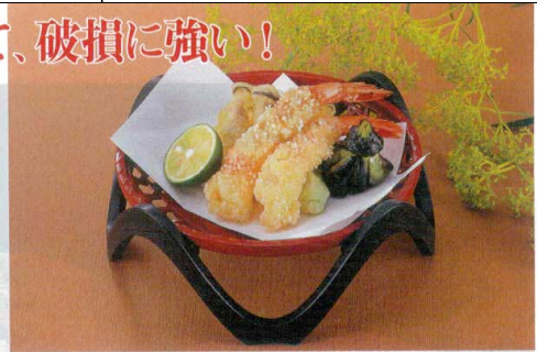
6-609-3 盆情盛器底板付 丸籠 朱 [A] 皿 φ165×22 (51310601)