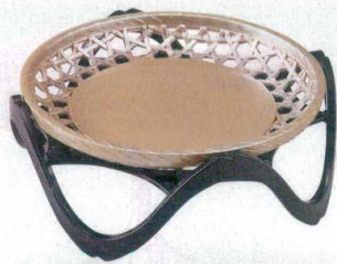
6-609-1 盆情盛器底板付 丸籠 黄金銀彩 [A] 皿 φ165×22 (55204340)