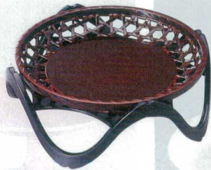
6-609-2 盆情盛器底板付 丸籠 溜 [A] 皿 φ165×22 (55006010)