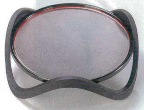
6-609-12 丸型盆情盛器 足付 銀河 [A] 5-507-11 (51310166)