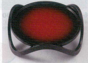
6-609-10 丸型盆情盛器 足付 朱黒ぼかし毘沙門天 [A] (51310146)