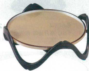
6-609-6 盆情盛器底板付 梅型皿 黄金銀彩天べつ甲 [A] 皿 φ163×11 (55204350)