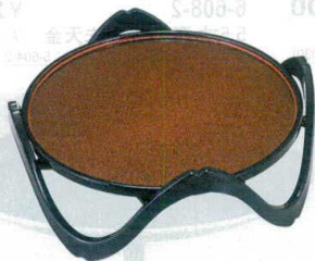
6-609-4 盆情盛器底板付 梅型皿 梨地天黒 [A] 皿 φ163×11 (55008400)