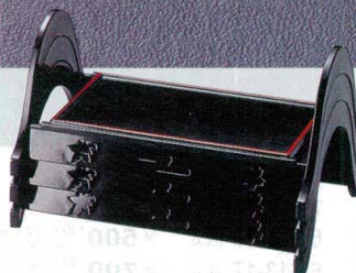
6-612-7 ¥1,150 ゆめまくら用長角皿 朱天黒/金LG板 [A] 199×118×13 5-510-7 (51012510)