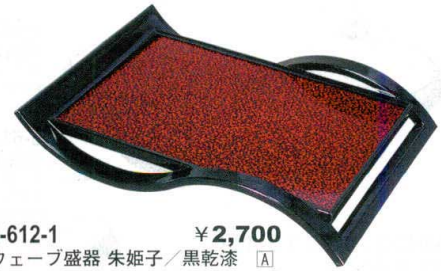
6-612-1 ¥2,700 ウェーブ盛器 朱姫子/黒乾漆 [A] 240×170×37 5-510-1 (15158700)