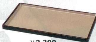
6-612-4 ¥2,300 ゆめまくら用長角皿 黄金銀彩べっ甲 [A] 199×118×13 (55204400)