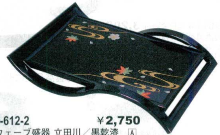
6-612-2 ¥2,750 ウェーブ盛器 立田川/黒乾漆 [A] 240×170×37 5-510-2 (15158710)