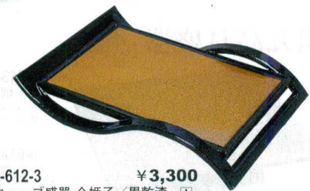
6-612-3 ¥3,300 ウェーブ盛器 金姫子/黒乾漆 [A] 240×170×37 5-510-3 (15158720)