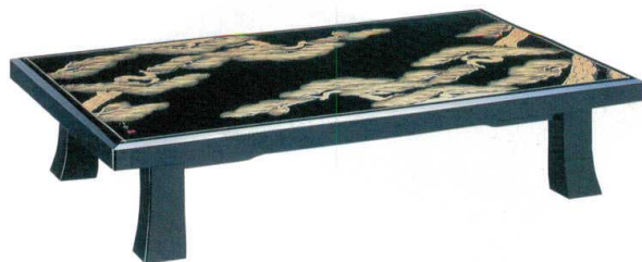
倭 老松 うるし沈金 (末広京脚型) ✳ 11-104-8 ¥ 648,000 (W1,500・D900・H320) 11-104-9 ¥ 720,000 (W1,800・D900・H320)