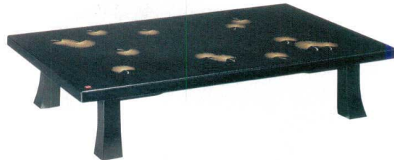
倭 松葉 うるし沈金 (御所京脚型) ✳ 11-104-4 ¥ 381,000 (W1,500・D900・H320) 11-104-5 ¥ 471,000 (W1,800・D900・H320)