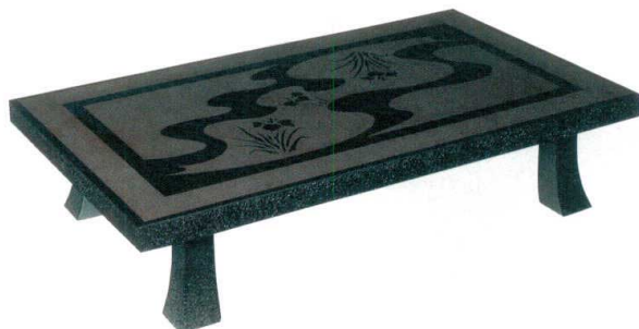
あやめ 乾漆 (龍宝型) ✳ 11-104-14 ¥ 1,215,000 (W1,500・D900・H330)