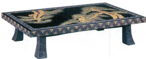
老松 うるし沈金 (龍宝型) ✳ 11-104-13 ¥ 1,386,000 (W1,500・D900・H330)