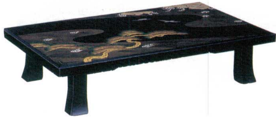
海景 うるし沈金 (末広京脚型) ✳ 11-104-1 ¥ 648,000 (W1,200・D900・H320) 11-104-2 ¥ 697,000 (W1,500・D900・H320) 11-104-3 ¥ 874,000 (W1,800・D900・H320)