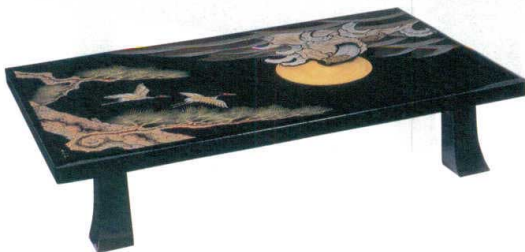
高砂 うるし沈金 (末広京脚型) ✳ 11-104-6 ¥ 900,000 (W1,500・D900・H320) 11-104-7 ¥ 1,080,000 (W1,800・D900・H320)