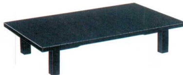
黒鏡面(御所角脚型) ✳ 11-106-45 ¥ 297,000 (W1,200・D900・H320) 11-106-46 ¥ 360,000 (W1,500・D900・H320) 11-106-47 ¥ 428,000 (W1,800・D900・H320)