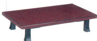
うるみ鏡面(末広京脚型) ✳ 11-106-36 ¥ 367,000 (W1,200・D900・H320) 11-106-37 ¥ 432,000 (W1,500・D900・H320) 11-106-38 ¥ 554,000 (W1,800・D900・H320)