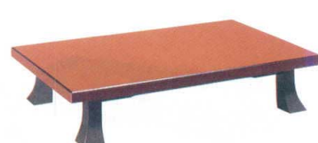
朱鏡面(末広京脚型) ✳ 11-106-39 ¥ 367,000 (W1,200・D900・H320) 11-106-40 ¥ 432,000 (W1,500・D900・H320) 11-106-41 ¥ 554,000 (W1,800・D900・H320)