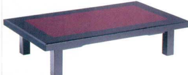
うるし 緑黒(御所角脚型) ✳ 11-106-5 ¥ 274,000 (W900・D900・H320) 11-106-6 ¥ 325,000 (W1,200・D900・H320) 11-106-7 ¥ 393,000 (W1,500・D900・H320) 11-106-8 ¥ 471,000 (W1,800・D900・H320)