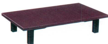
うるみ鏡面(御所角脚型) ✳ 11-106-42 ¥ 297,000 (W1,200・D900・H320) 11-106-43 ¥ 360,000 (W1,500・D900・H320) 11-106-44 ¥ 428,000 (W1,800・D900・H320)