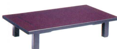
うるし 額縁 うるみ(御所角脚型) ✳ 11-106-17 ¥ 274,000 (W900・D900・H320) 11-106-18 ¥ 325,000 (W1,200・D900・H320) 11-106-19 ¥ 393,000 (W1,500・D900・H320) 11-106-20 ¥ 471,000 (W1,800・D900・H320)