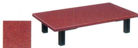
ウレタン 朱(御所角脚型) ✳ 11-106-29 ¥ 204,000 (W900・D900・H320) 11-106-30 ¥ 243,000 (W1,200・D900・H320) 11-106-31 ¥ 291,000 (W1,500・D900・H320) 11-106-32 ¥ 356,000 (W1,800・D900・H320)