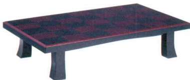
うるし 一松 うるみ(末広京脚型) ✳ 11-106-13 ¥ 325,000 (W900・D900・H320) 11-106-14 ¥ 428,000 (W1,200・D900・H320) 11-106-15 ¥ 538,000 (W1,500・D900・H320) 11-106-16 ¥ 633,000 (W1,800・D900・H320)