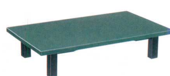
グリーン鏡面(御所角脚型) ✳ 11-106-48 ¥ 297,000 (W1,200・D900・H320) 11-106-49 ¥ 360,000 (W1,500・D900・H320) 11-106-50 ¥ 428,000 (W1,800・D900・H320)