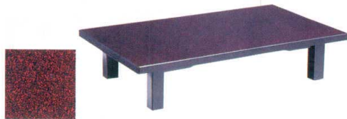
ウレタン うるみ(御所角脚型) ✳ 11-106-25 ¥ 204,000 (W900・D900・H320) 11-106-26 ¥ 243,000 (W1,200・D900・H320) 11-106-27 ¥ 291,000 (W1,500・D900・H320) 11-106-28 ¥ 356,000 (W1,800・D900・H320)