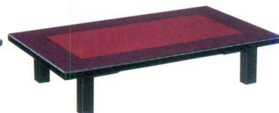
うるし 塗り分 うるみ/朱(御所角脚型) ✳ 11-106-21 ¥ 274,000 (W900・D900・H320) 11-106-22 ¥ 325,000 (W1,200・D900・H320) 11-106-23 ¥ 393,000 (W1,500・D900・H320) 11-106-24 ¥ 471,000 (W1,800・D900・H320)