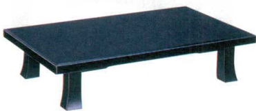
黒鏡面(末広京脚型) ✳ 11-106-33 ¥ 342,000 (W1,200・D900・H320) 11-106-34 ¥ 406,000 (W1,500・D900・H320) 11-106-35 ¥ 486,000 (W1,800・D900・H320)