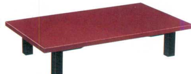
うるし 朱(御所角脚型) ✳ 11-106-9 ¥ 274,000 (W900・D900・H320) 11-106-10 ¥ 325,000 (W1,200・D900・H320) 11-106-11 ¥ 393,000 (W1,500・D900・H320) 11-106-12 ¥ 471,000 (W1,800・D900・H320)