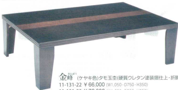
金峰 (ケヤキ色)タモ玉歪(硬質ウレタン塗装摺り仕上・折脚・軽量テーブル) 11-131-22 ¥ 66,000 (W1,050・D750・H350) 11-131-23 ¥ 72,600 (W1,200・D800・H350) 11-131-24 ¥ 79,700 (W1,350・D850・H350) 11-131-25 ¥ 86,300 (W1,500・D850・H350)