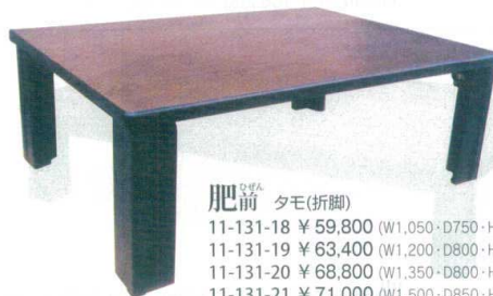
肥前 タモ(折脚) 11-131-18 ¥ 59,800 (W1,050・D750・H335) 11-131-19 ¥ 63,400 (W1,200・D800・H335) 11-131-20 ¥ 68,800 (W1,350・D800・H335) 11-131-21 ¥ 71,000 (W1,500・D850・H335)