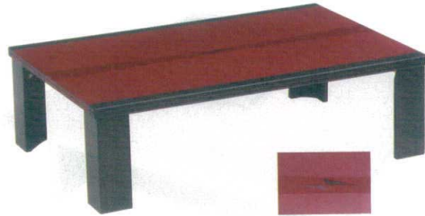
朱雀 朱色(演漆仕上)折脚 11-131-3 ¥ 65,200 (W900・D600・H350) 11-131-4 ¥ 71,400 (W1,050・D750・H350) 11-131-5 ¥ 72,500 (W1,200・D800・H350) 11-131-6 ¥ 90,600 (W1,500・D850・H350)