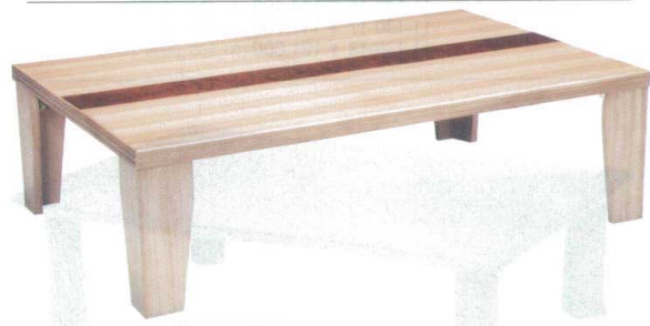
金峰 (白木)タモ玉歪(硬質ウレタン塗装摺り仕上・折脚・軽量テーブル) 11-131-26 ¥ 66,000 (W1,050・D750・H350) 11-131-27 ¥ 72,600 (W1,200・D800・H350) 11-131-28 ¥ 79,700 (W1,350・D850・H350) 11-131-29 ¥ 86,300 (W1,500・D850・H350)