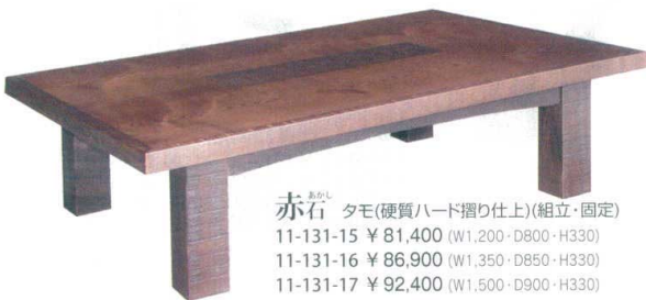
赤石 タモ(硬質ハード摺り仕上)(組立・固定) 11-131-15 ¥ 81,400 (W1,200・D800・H330) 11-131-16 ¥ 86,900 (W1,350・D850・H330) 11-131-17 ¥ 92,400 (W1,500・D900・H330)