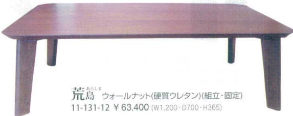
荒島 ウォールナット(硬質ウレタン)(組立・固定) 11-131-12 ¥ 63,400 (W1,200・D700・H365)