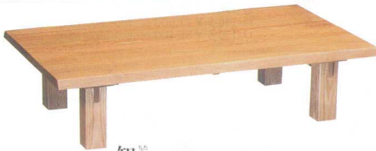
知多 タモ集成無垢(組立・固定) 11-131-7 ¥ 142,000 (W1,300・D850・H360) 11-131-8 ¥ 163,000 (W1,500・D900・H360) 11-131-9 ¥ 189,000 (W1,800・D900・H360)