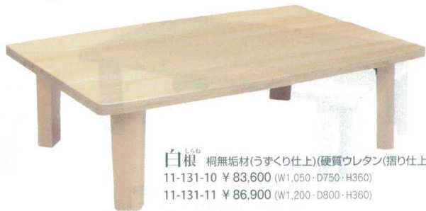
白根 桐無垢材(うすくり仕上)(硬質ウレタン(摺り仕上)) 11-131-10 ¥ 83,600 (W1,050・D750・H360) 11-131-11 ¥ 86,900 (W1,200・D800・H360)