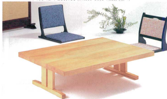
米松 寄せ木 白 板型