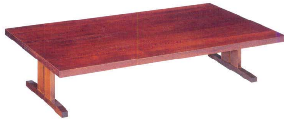
栓 せん ケヤキ色 無垢寄せ木 板型