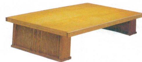
11-138-21 箱脚型座卓 ¥ 330,000 (W1,500・D900・H330) ナラ突板 ナチュラル