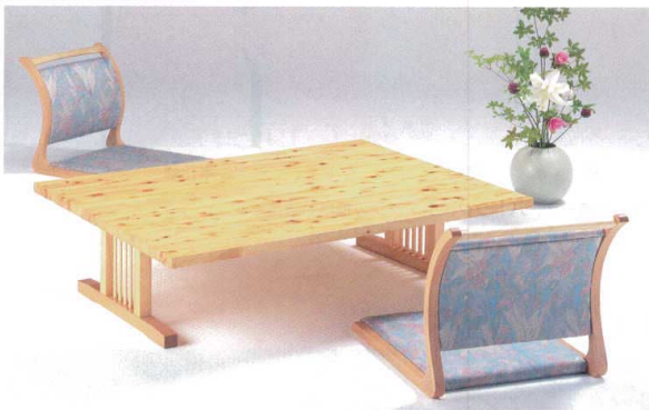
寄せ木 節 格子型