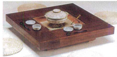
11-144-3 囲炉裏(炭火用) 松節付ムク板 ¥ 393,800 (W1,000・D1,000・H250)