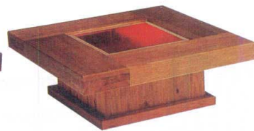
11-144-7 火鉢松節付ムク板 ¥ 501,600 (W1,000・D1,000・H330) 11-144-8 火鉢ケヤキ突板 ✕ ¥ 369,600 (W1,000・D1,000・H330)