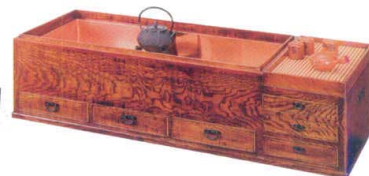
11-144-11 長火鉢タモ材無垢 ¥ 1,815,000 (W1,510・D520・H370)