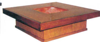
11-144-10 火鉢 松突板 ✕ ¥ 475,200 (W1,200・D1,200・H330)