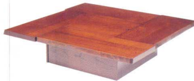
11-144-2 火鉢タムムク ¥ 402,600 (W1,000・D1,000・H320)