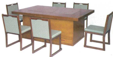
11-144-12 火鉢 栓突板 オーク色 ¥ 900,000 (W1,800・D1,100・H700) ステンレス内寸 (W1,200・D500・H150 天板上部からの深さ)