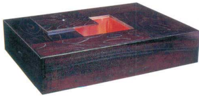
11-144-1 火鉢 割烹用 ケヤキ突板 ✕ ¥ 303,600 (W1,200・D900・H210)