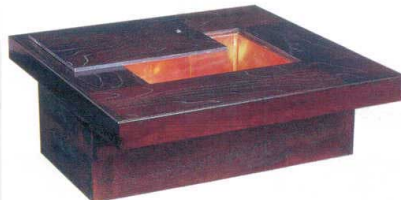
11-144-6 火鉢 割烹タイプ ケヤキ突板 ✕ ¥ 422,400 (W1,200・D900・H330)