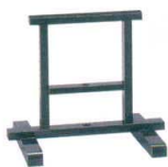
11-169-3 木製傘立(黒) ¥ 49,000 (W600・D500・H700) 11-169-4 木製傘立(白木) ¥ 49,000 (W600・D500・H700)