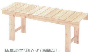
桧長椅子(組立式)塗装なし ※11-169-15 ¥ 10,800 (W850・D420・H420) ※11-169-16 ¥ 15,700 (W1,120・D420・H420) ※11-169-17 ¥ 18,700 (W1,400・D420・H420)