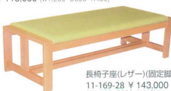
長椅子座(レザー)(固定脚)※ 11-169-28 ¥ 143,000 (W1,500・D600・H410) 白木 ウレタン塗装