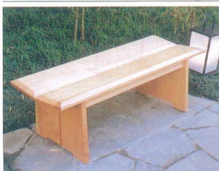
11-169-23 米桧 長椅子 白木塗 (写真は白木塗) ¥ 113,000 (W1,200・D600・H430) 11-169-24 米桧 長椅子 ケヤキ色 ¥ 113,000 (W1,200・D600・H430)