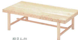
桧えん台 ※11-169-21 ¥ 59,000 (約W1,500・D820・H450)(組立式) ※11-169-22 ¥ 68,700 (約W1,800・D900・H450)(組立式)