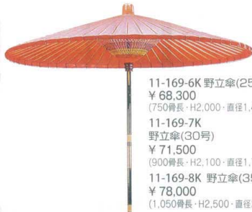
11-169-6K 野立傘(25号) ¥ 68,300 (750骨長・H2,000・直径1,400) 11-169-7K 野立傘(30号) ¥ 71,500 (900骨長・H2,100・直径1,760) 11-169-8K 野立傘(35号) ¥ 78,000 (1,050骨長・H2,500・直径2,060)