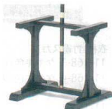
11-169-5 木製傘立(黒) ¥ 49,000 (W500・D670・H610)