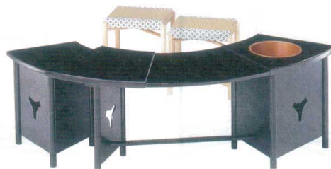
11-169-14 扇面末広棚 ¥ 383,000