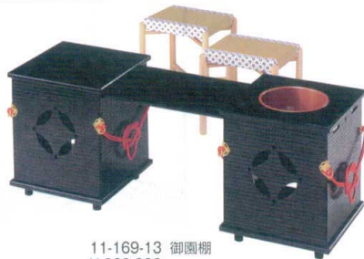
11-169-13 御園棚 ¥ 330,000