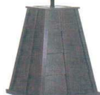
11-169-9 木製傘立(黒) ¥ 46,000 (W480・D480・H600・穴42φ)