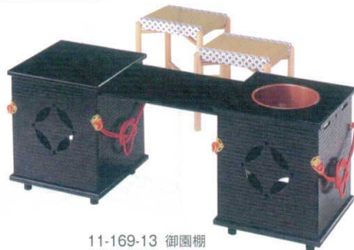
11-169-13 御園棚 ¥ 330,000