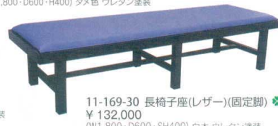
11-169-30 長椅子座(レザー)(固定脚)※ ¥ 132,000 (W1,800・D600・SH400) 白木 ウレタン塗装 布も同価格です。