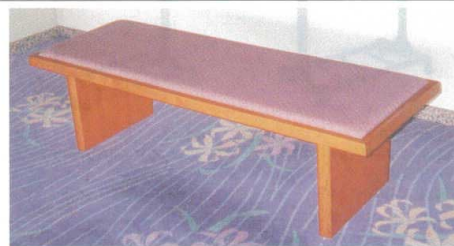
長椅子座(レザー)(固定脚)※ 11-169-26 ¥ 110,000 (W1,200・D600・H400) タメ色 ウレタン塗装 11-169-27 ¥ 127,000 (W1,800・D600・H400) タメ色 ウレタン塗装