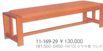
11-169-29 ¥ 130,000 (W1,500・D450・H410) ケヤキ色 ウレタン塗装