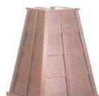
11-169-10 木製傘立(ケヤキ色) ¥ 46,000 (W480・D480・H600)