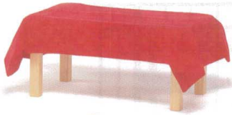
11-169-1 毛せんマット(赤) ¥ 22,000 (W2,000・D1,800) 11-169-2 毛せんマット(グリーン) ¥ 22,000 (W2,000・D1,800)