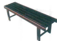
ケヤキ色塗装・クリア塗装の特注も承ります。詳細はお問い合わせ下さい。