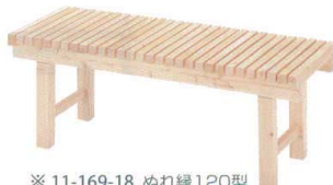
※11-169-18 めれ縁120型 ¥ 39,200 (約W1,200・D450・H450)(組立式) ※11-169-19 めれ縁150型 ¥ 46,700 (約W1,500・D450・H450)(組立式) ※11-169-20 めれ縁180型 ¥ 59,000 (約W1,800・D450・H450)(組立式)