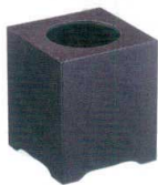
11-173-4 困 ☉ うるみ乾漆 ¥ 7,600 (W180・D180・H190)