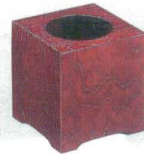
11-173-1 困 ☉ ケヤキスリ ¥ 5,500 (W180・D180・H190)