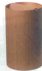
11-173-17 困 ☉ 回転蓋付(チーク)大 ¥ 14,000 (240φ・H390)