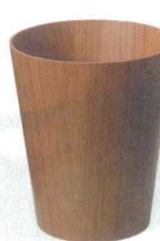
11-173-15 困 ☉ 上開き(チーク)中 ¥ 7,050 (255φ・H300)