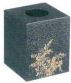
11-173-6 困 ☉ 黒目ハジキ萩 ¥ 5,200 (W180・D180・H210)