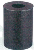
11-173-12 困 ☉ 丸八光塗 うるみ ¥ 23,000 (210φ・H285)