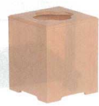
11-173-3 困 ☉ タモ ¥ 7,000 (W180・D180・H190)