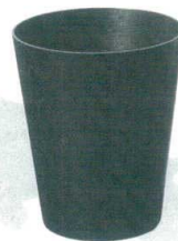
11-173-16 困 ☉ 黒上開き(栓)特大 ブラック ¥ 7,800 (255φ・H300)