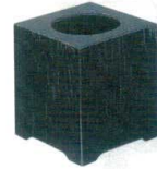
11-173-2 困 ☉ ケヤキ黒 ¥ 5,500 (W180・D180・H190)