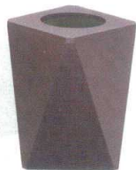
11-173-10 困 ☉ うるみ石目 ¥ 9,200 (W180・D180・H198)