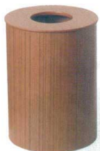
11-173-13 困 ☉ 蓋付(チーク)大 ¥ 7,050 (205φ・H285)