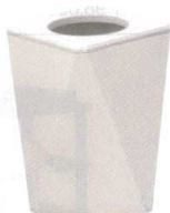
11-173-9 困 ☉ ホワイト石目 ¥ 9,200 (W180・D180・H198)