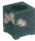
11-173-7 困 ☉ 松沈金 ¥ 45,000 (W180・D180・H190)