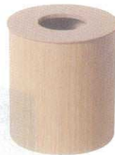
11-173-14 困 ☉ 蓋付(栓)中 ナチュラル ¥ 6,300 (185φ・H210)