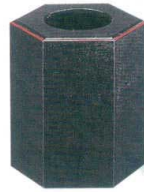
11-173-11 困 ☉ 六角千筋 ¥ 7,900 (W230・D230・H250)