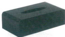
11-177-8 TS-O3B ブラック ¥ 8,000 (W255・D135・H77)