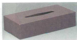
11-177-12 ㊦ レギュラーティッシュ ¥ 6,800 (W266・D138・H62)