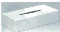
11-177-11 ㊦ レギュラーティッシュ ¥ 6,000 (W266・D138・H62)