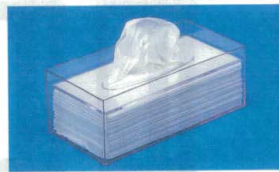
11-177-20 ディスコティッシュケース ¥ 1,200 (W243・D123・H86) スチロール樹脂