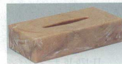
11-177-13 ㊦ レギュラーティッシュ ¥ 8,300 (W266・D138・H62)