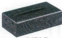
11-177-2 ㊦ 黒スリ(L) ¥ 5,700 (W270・D145・H80)