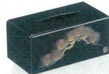
11-177-6 ㊦ 松沈金 ¥ 26,500 (W270・D145・H120)