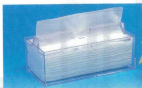
11-177-19 ペーパータオルケース ¥ 1,400 (W243・D123・H86) スチロール樹脂