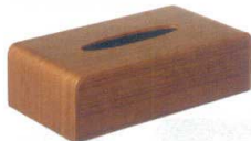
11-177-7 TS-O3T チーク調 ¥ 8,000 (W255・D135・H77)