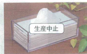
11-177-21 デスクシックタイプティッシュケース ¥ 1,500 (W249・D129・H86) スチロール樹脂