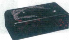
11-177-17 ㊦㊧ 別甲 かすみ草 ¥ 2,600 (W260・D135・H80)