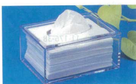
11-177-18 ポケットティッシュケース ¥ 550 (W123・D88・H57) スチロール樹脂