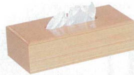
11-177-3 ㊦ 白木ティッシュケース ¥ 7,560 (W270・D145・H80)