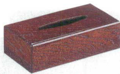
11-177-1 ㊦ 樺スリ(L) ¥ 5,700 (W270・D145・H80)