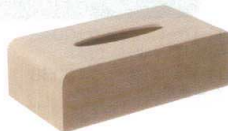
11-177-9 TS-O3H ホワイトチーク調 ¥ 8,300 (W255・D135・H77)