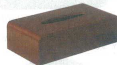
11-177-10 TS-O3WN ウォルナット ¥ 8,700 (W255・D135・H77)