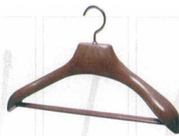
11-184-5 ¥ 4,800 (W420・D70・H270) 材質:本体/ポリプロピレン フック/ポリエチレン フック/スチール(ブラックニッケルメッキ) ネジ/ステンレス(プロテクト処理)