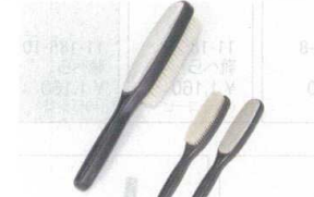
11-184-10 クリーンブラシスリム毛ブラシ付 ¥ 1,700 (W245・D48・H38) 材質:本体/ABS樹脂 / ポリエステル 毛/豚毛 色:BR