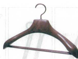
11-184-6 ¥ 4,800 (W420・D70・H270) 材質:本体/ポリプロピレン フック/ポリエチレン フック/スチール(ブラックニッケルメッキ) ネジ/ステンレス(プロテクト処理)