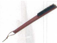
11-184-15K ¥ 840 (W380・D42・H30)