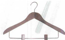
11-184-4 木製ハンガーピンチタイプ ¥ 2,280 (W420・H16) 材質:木部/ブナ材 色:アンティークブラウン