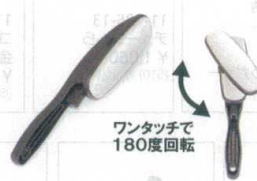
11-184-9 クリーンブラシワンタッチ ¥ 1,300 (W240・D45・H42) 材質:本体/ABS樹脂 / ネ/スチール 布/ポリエステル 色:BR