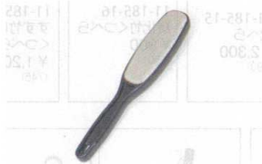
11-184-8 クリーンブラシスリムダブル ¥ 980 (W245・D48・H27) 材質:本体/ABS樹脂 布/ポリエステル 色:BR