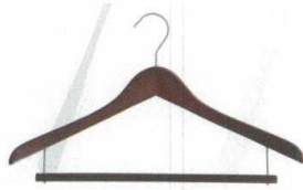
11-184-1 木製バータイプ ¥ 1,240 (W420・H13) 材質:木部/メープル材 金具/スチール製WNIメッキ 色:ブラウン