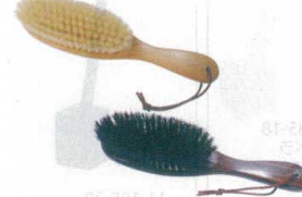
11-184-13 洋服ブラシ ¥ 2,480 (L250mm) 材質:柄/天然木 / 毛/高級豚毛 色:柄/白木 / 毛/白 柄/黒檀柄 / 毛/黒