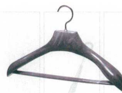
11-184-7 ¥ 4,800 (W420・D70・H270) 材質:本体/ポリプロピレン フック/ポリエチレン フック/スチール(ブラックニッケルメッキ) ネジ/ステンレス(プロテクト処理)