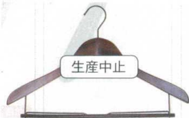
11-184-3 木製ハンガーバータイプ ¥ 1,950 (W420・H16) 材質:木部/ブナ材 色:アンティークブラウン