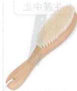
11-184-12 洋服ブラシDX ¥ 1,700 (W250・D52・H47) 材質:本体/天然木 / 毛/豚毛