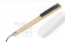
11-184-14K ¥ 780 (W380・D42・H30)