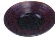
11-190-4 ☐ 4寸新干筋溜茶托 ¥ 400 (φ120・H15)