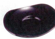
11-190-8 ☐ 小判無地溜茶托 ¥ 650 (W135・D90・H15)