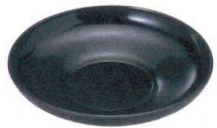
11-190-16 ☐ 3.6寸ダルマ茶托 黒 ¥ 530 (φ108・H20)