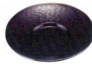
11-190-3 ☐ 4寸トントン木彫溜茶托 ¥ 400 (φ120・H15)