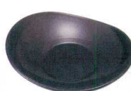
11-190-31 ☐ 小判茶托 黒 ¥ 530 (W92・D70・H16)