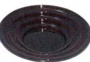
11-190-13 ☐ 溜富士茶托 ¥ 680 (φ120・H20)