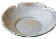
11-190-25 ☐ 3.6寸 梅無地茶托 銀 ¥ 880 (φ108・H19)