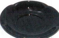
11-190-12 ☐ 溜新梅茶托 ¥ 780 (φ120・H20)