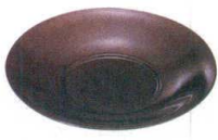
11-190-22 ☐ 4寸 コリ型茶托 溜 ¥ 840 (φ121・H18)