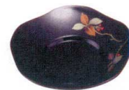
11-190-10 ☐ 4.2寸雅梅溜数柑子茶托 ¥ 1,350 (φ125・H15)