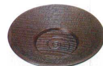
11-190-28 ☐ 3.8寸干筋茶托 ケヤキ ¥ 620 (φ114・H19)