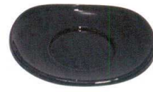
11-190-9 ☐ 溜つつみ茶托 ¥ 680 (W123・D108・H17)