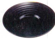
11-190-2 ☐ 4寸口口溜茶托 ¥ 400 (φ120・H15)