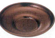
11-190-18 ☐ 4寸布目茶托 溜 ¥ 750 (φ120・H20)