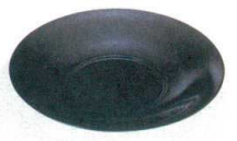
11-190-21 ☐ 4寸 コリ型茶托 黒 ¥ 660 (φ121・H18)