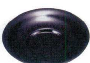
11-190-14 ☐ 溜4寸百合総黒茶托 ¥ 1,220 (φ120・H15)