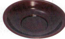
11-190-7 ☐ 栃百合型茶托 ¥ 850 (φ120・H20)