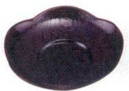
11-190-6 ☐ 4寸新梅木彫溜茶托 ¥ 400 (φ120・H15)