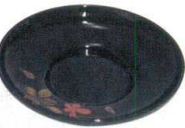
11-190-19 ☐ 溜4寸ダルマ茶托 桜 ¥ 880 (φ118・H20)