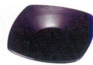
11-190-5 ☐ 胸張木彫溜茶托 ¥ 400 (W120・D120・H15)