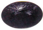
11-190-1 ☐ 4寸八つ手溜茶托 ¥ 400 (φ120・H15)