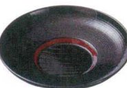
11-190-30 ☐ 4寸木目茶托 黒内朱ライン ¥ 530 (φ119・H20)