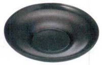
11-190-17 ☐ 4.2寸ダルマ茶托 黒乾漆 ¥ 620 (φ126・H23)