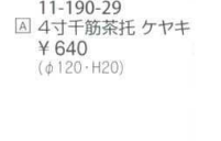
11-190-29 ☐ 4寸干筋茶托 ケヤキ ¥ 640 (φ120・H20)