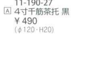
11-190-27 ☐ 4寸干筋茶托 黒 ¥ 490 (φ120・H20)