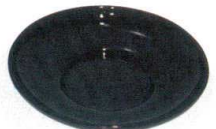
11-190-11 ☐ 溜4寸ダルマ茶托 ¥ 480 (φ118・H20)