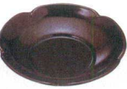
11-190-24 ☐ 3.6寸 梅無地茶托 溜 ¥ 700 (φ108・H19)