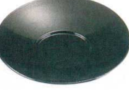
11-190-23 ☐ 4.2寸茶托 黒乾漆 ¥ 700 (φ126・H24)