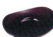
11-190-15 ☐ 溜4.5寸四季小判総溜茶托 ¥ 1,560 (W135・D90・H15)