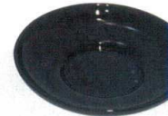
11-190-20 ☐ 溜4寸ダルマ茶托 明月 ¥ 680 (φ118・H20)