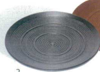
11-191-2 困 干筋小皿 黒 ¥ 720 (φ120) 11-191-3 困 干筋小皿 朱 ¥ 720 (φ120)