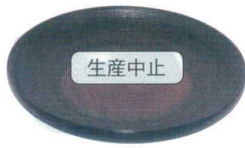
11-191-1 困 5寸刷毛目皿黒 ¥ 1,560 (φ150・H20)