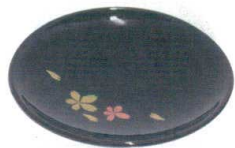
11-191-23 困 溜 4.5寸 碁石 銘々皿 桜 ¥ 1,020 (φ140・H15)