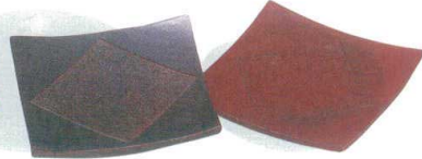
11-191-11 困 布貼 正角皿 根来 ¥ 1,680 (W120・D120・H18) 11-191-12 困 布貼 正角皿 曙 ¥ 1,680 (W120・D120・H18)