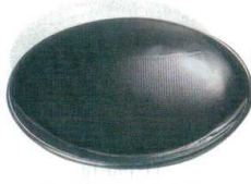
11-191-20 困 朱 4.5寸 布目黒 銘々皿 ¥ 750 (φ139・H19)