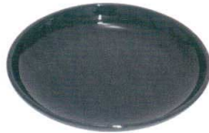
11-191-14 困 溜 4.5寸 取り皿 ¥ 1,350 (φ140・H15)