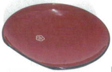
11-191-25 困 朱 4.5寸 半月皿 明月 ¥ 970 (φ138・H18)