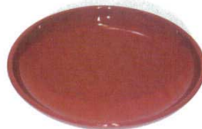
11-191-15 困 朱 4.5寸 取り皿 ¥ 1,350 (φ140・H15)