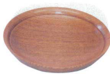
11-191-8 困 5寸ケヤキ 銘々皿 ¥ 1,680 (φ145・H22)