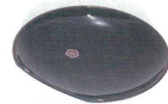
11-191-24 困 溜 4.5寸 半月皿 明月 ¥ 970 (φ138・H18)