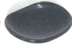
11-191-17 困 溜 つつみ 銘々皿 ¥ 850 (W140・D117・H18)