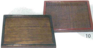
11-191-9 困 正角皿 天黒 ¥ 640 (W139・D139・H10) 11-191-10 困 正角皿 天朱 ¥ 640 (W139・D139・H10)