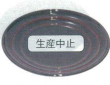
11-191-19 困 溜 富士 銘々皿 ¥ 850 (φ140・H15)