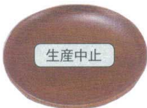
11-191-7 困 森の器 4.5寸銘々皿 ¥ 960 (φ135)