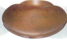
11-191-4 困 5寸 ねじ梅 銘々皿 ¥ 1,120 (φ150)