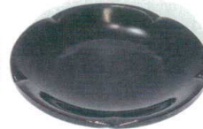
11-191-16 困 溜 新梅 銘々皿 ¥ 950 (φ140・H15)