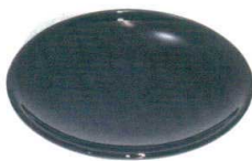
11-191-13 困 溜 4.5寸 碁石 銘々皿 ¥ 680 (φ140・H15)