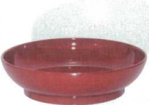
11-191-30 困 朱 5.0寸 お好皿 ¥ 2,200 (φ148・H40)