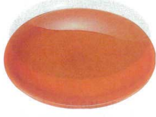
11-191-22 困 溜 4.5寸 平型春慶 銘々皿 ¥ 970 (φ134・H15)