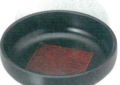
11-191-33 困 溜 6.5寸 黒内角布目 ¥ 2,720 (φ190・H47)