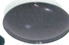
11-191-28 困 溜 4.5寸 碁石 銘々皿 明月 ¥ 850 (φ140・H15)