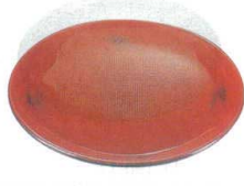
11-191-21 困 朱 4.5寸 布目根来 銘々皿 ¥ 920 (φ139・H19)