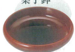
11-191-32 困 溜 7.5寸 朱ぼかし ¥ 2,300 (φ230・H48)