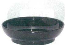
11-191-29 困 溜 5.0寸 お好皿 ¥ 2,200 (φ148・H40)