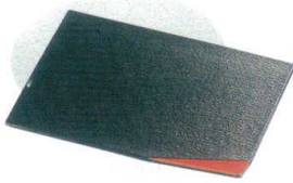
11-191-18 困 5寸 隅折黒朱皿 ¥ 490 (W150・D105・H12)