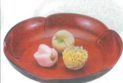
11-191-31 困 溜 7.8寸 梅型 朱に黒カスリ ¥ 2,100 (φ223・H40)