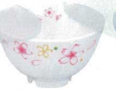
11-193-42 樹脂湯呑さくら ¥ 840 (95φ・H55)