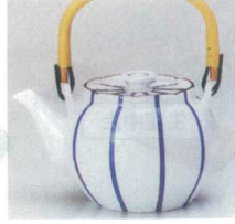
11-193-5 夕三筋 8号土瓶 ¥ 7,400 (1360cc) 有田焼