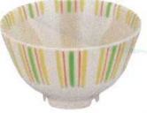
11-193-41 樹脂湯呑春とくさ ¥ 840 (95φ・H55)