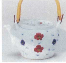
11-193-3 しだれ梅 8号土瓶 ¥ 7,100 (1400cc) 有田焼