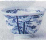
11-193-25 厚口竹林反煎茶 ¥ 750 (90φ・H50)