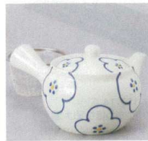
11-193-16 一珍梅急須(U) ¥ 2,900 (400cc) (108φ・H90)