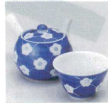
11-193-19 ゴス梅中急須 ¥ 3,200 (400cc) 有田焼