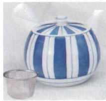
11-193-10 一珍濃十草中急須(U) ¥ 4,300 (400cc) 有田焼