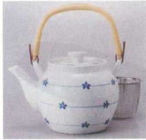
11-193-1 都花 U付8号土瓶 ¥ 5,100 (1525cc)