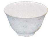
11-193-40 樹脂湯呑青小紋 ¥ 690 (95φ・H56)