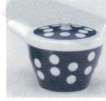
11-193-14 水玉2号急須 ¥ 3,400 (400cc) 有田焼