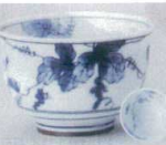
11-193-32 内外ドウ2.8反煎茶 ¥ 870 (84φ・H56)