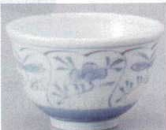
11-193-24 なづな厚口反煎茶 ¥ 700 (180cc) (90φ・H58)