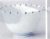
11-193-35 測二色十草反煎茶 ¥ 860 (92φ・H55)