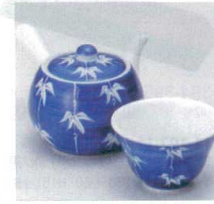
11-193-21 ゴス笛中急須 ¥ 3,200 (400cc) 有田焼