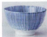
11-193-23 十草煎茶 ¥ 380 (180cc) (91φ・H57)