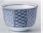
11-193-27 京祥瑞京煎茶 ¥ 710 (80φ・H56)