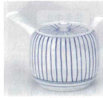
11-193-12 立杵中丸急須 ¥ 4,300 (450cc) 有田焼