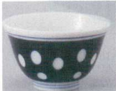
11-193-26 水玉厚口反干茶 ¥ 700 (90φ・H55)