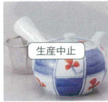
11-193-11 染錦市松小花急須 籠網 ¥ 3,100 (350cc) (110φ・H85)