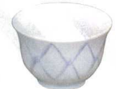
11-193-38 樹脂湯呑網目 ¥ 540 (92φ・H60)