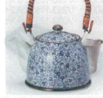
11-193-8 古染ツル唐草 8号土瓶(U) ¥ 8,300 (1500cc) 有田焼