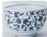
11-193-30 唐草2.8反煎茶 ¥ 750 (84φ・H56)