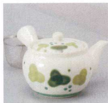
11-193-15 緑彩ぶどう急須(U) ¥ 2,900 (400cc) (108φ・H90)