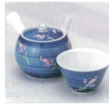
11-193-17 花娘中急須 ¥ 3,900 (400cc) 有田焼