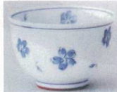
11-193-33 内外小花2.8反煎茶 ¥ 870 (84φ・H56)