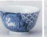
11-193-28 丸紋うさぎ厚口煎茶 ¥ 800 (90φ・H52)