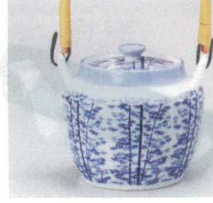
11-193-7 竹林 8号土瓶 ¥ 6,900 (1600cc)