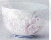
11-193-34 一珍ゆり反煎茶 ¥ 860 (86φ・H56)