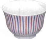
11-193-39 樹脂湯呑赤青十草 ¥ 530 (92φ・H60)