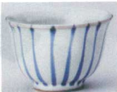
11-193-31 呉須十草反煎茶 ¥ 840 (88φ・H60)