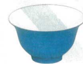
11-193-37 樹脂湯呑ブルー ¥ 490 (96φ・H56)