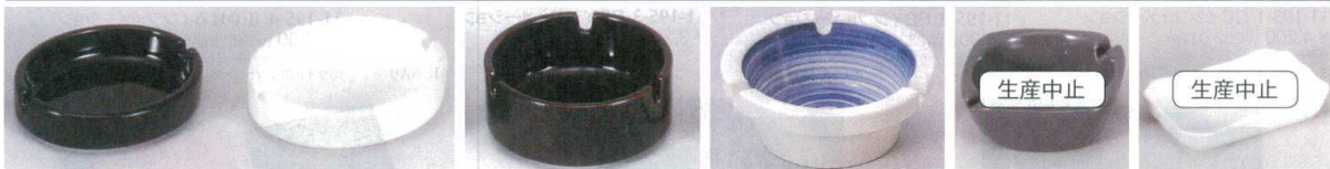
11-194-7 夕円灰皿(黒) ¥470 (W105・D85・H25) 11-194-8 夕円灰皿(白) ¥490 (W105・D85・H25) 11-194-9 天目切立3.0灰皿 ¥680 (105φ・H45) 11-194-10 F型ブルー渦灰皿 ¥750 (112φ・H45) 11-194-11 スクエア灰皿グレー ¥760 (W107・D107・H43) 11-194-12 ホワイトジャスト灰皿 ¥750 (W111・D77・H20)