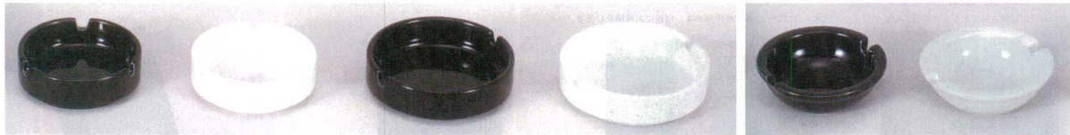
11-194-1 黒丸三ツ切スタック灰皿 ¥450 (90φ・H28) 11-194-2 白丸三ツ切スタック灰皿 ¥350 (90φ・H28) 11-194-3 黒丸二ツ切スタック灰皿 ¥510 (105φ・H30) 11-194-4 白丸二ツ切スタック灰皿 ¥420 (105φ・H30) 11-194-5 黒U型灰皿 ¥540 (100φ・H32) 11-194-6 白U型灰皿 ¥450 (100φ・H32)