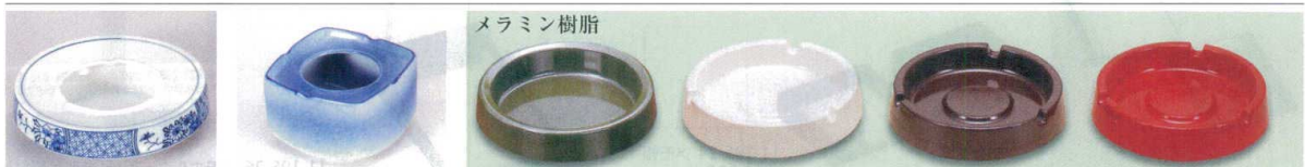
11-194-43 菊間取6.0灰皿 ¥2,800 (190φ・H50) 11-194-44 吹墨角灰皿(小) ¥1,680 (W113・D113・H65) 11-194-45 カフェ ¥610 (109φ・H25) 11-194-46 スナック ホワイト ¥620 (108φ・H22) 11-194-47 スナック 茶 ¥620 (108φ・H22) 11-194-48 スナック 朱 ¥620 (108φ・H22)