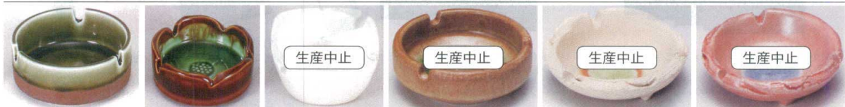
11-194-13 ビードロ3.0灰皿 ¥720 (102φ・H43) 11-194-14 ガラス入梅形灰皿 ¥760 (105φ・H35) 11-194-15 スクエア灰皿白 生産中止 11-194-16 小丸火消灰皿 生産中止 11-194-17 無釉グリーンひねり灰皿(中) 生産中止 ¥940 (116φ・H40) 11-194-18 ピンクひねり灰皿(中) 生産中止 ¥870 (113φ・H36)