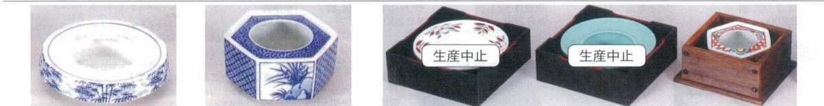
11-194-35 竹林4.5灰皿 ¥1,080 (135φ・H38) 11-194-36 祥瑞六角灰皿 ¥1,950 (120φ・H60) 11-194-37 錦花園灰皿 ¥3,920 (162φ・H50) 11-194-38 灰皿用木枠 ¥1,820 (内寸W170・D170・H57) 11-194-39 トルコ5.5灰皿 ¥2,590 (160φ・H53) 11-194-40 灰皿用木枠 ¥1,820 (内寸W170・D170・H57) 11-194-41 赤絵万歴4.0灰皿(木枠付) ¥4,900 (木枠W165・D150・H75 灰皿120φ・H50) 11-194-42 赤絵万歴4.0灰皿のみ ¥2,800 (120φ・H50)