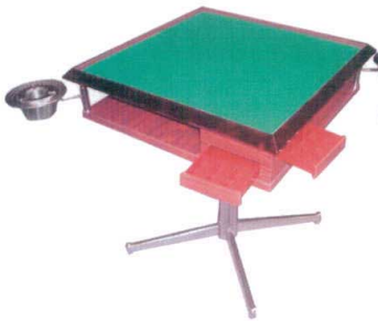
11-199-4 立卓 ¥ 97,500 (W660・D660・H750) 2面灰血店種ケース横付型