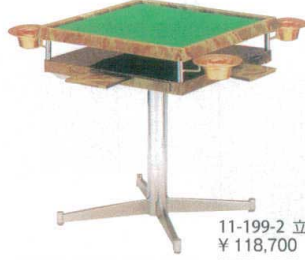
11-199-2 立卓 ¥ 118,700 (W660・D660・H750)