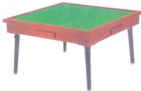
11-199-6 座卓 ¥ 35,800 (W660・D660・H370)