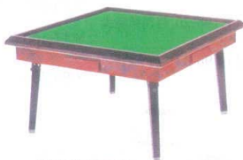
11-199-7 座卓 ¥ 48,800 (W660・D660・H370)