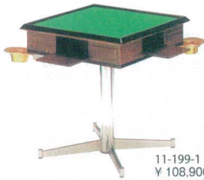
11-199-1 立卓 ¥ 108,900 (W660・D660・H750)