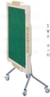
11-199-9 手打麻雀卓 ジャンロード ¥ 36,800 本体サイズ 立卓時: (W665・D865・H720) 折り畳み時: (W665・D320・H1,150) 本体重量 約14.5kg マットサイズ 約700×700 材質 天板ベース部: アルボリック 枠部: ABS樹脂 脚部: スチール 牌収納バッグ(付属品): ナイロン