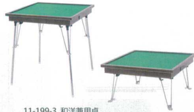
11-199-3 和洋兼用卓 ¥ 61,800 (W660・D660・H370~750)