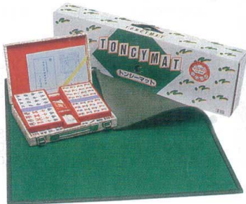
11-199-10 マットのみ ¥ 10,100 (W690・D690)