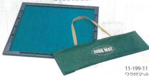
11-199-11 ワク付マットのみ ¥ 5,200

室内で簡単に、又、アウトドアでも・・・ バッグに入れて携帯に便利!! 丸めてコンパクトに収納。 場所をとりません!