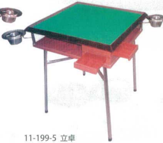
11-199-5 立卓 ¥ 87,800 (W660・D660・H750) 2面灰血店種ケース横付型