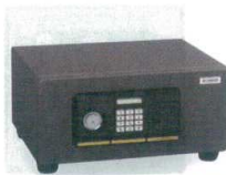
11-201-11K テンキー式 運賃 ¥48,500 (外寸:W410・D364・H213 内寸:W330・D230・H105 有効開口:W330・D230・H105) 質量:20kg 内容積:8ℓ 付属品:トレー1枚、単3形乾電池4本 ※トレー内寸:W312・D222・H39 ※この商品は30分耐火性能です。