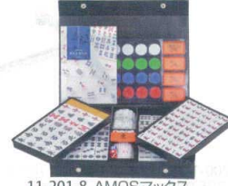
11-201-8 AMOSマックス ¥11,100

■ホテルや旅館でも安心していただけるプライベートボックスとして大活躍 ■マスターキー仕様は、1本の鍵で各部屋の金庫を管理できます