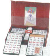
11-201-1 さんご ¥7,800