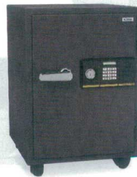
11-201-16K テンキー式 運賃 ¥215,000 (外寸:W463・D523・H669 内寸:W325・D336・H470 有効開口:W295・D336(322)・H354) 質量:103kg 内容積:51ℓ 付属品:棚板1枚、鍵引出し1個、単3形乾電池4本 ※引出し内寸:W297・D260・H77