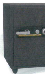
11-201-15K ダイヤル+シリンダー式 運賃 ¥146,000 (外寸:W463・D526・H669 内寸:W325・D336・H470 有効開口:W295・D336(322)・H354) 質量:103kg 内容積:51ℓ 付属品:棚板1枚、鍵引出し1個 ※引出し内寸:W297・D260・H77