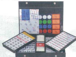
11-201-3 AMOSギャバン ¥8,450