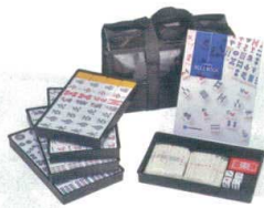
11-201-2 AMOSモンスター ¥7,150