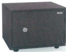
11-201-10K シリンダー式 運賃 ¥62,500 (外寸:W484・D419・H372 内寸:W354・D257・H214 有効開口:W324・D257・H214) 質量:55kg 内容積:19.5ℓ 付属品:トレー1枚 ※トレー内寸:W344・D214・H42 ※この商品は30分耐火性能です。