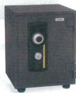
11-201-14K ダイヤル+シリンダー式 運賃 ¥36,000 (外寸:W336・D357・H444 内寸:W276・D220・H356 有効開口:W214・D220・H294) 質量:27kg 内容積:21.6ℓ 付属品:棚板1枚 ※この商品は30分耐火性能です。