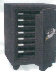
11-201-17K ダイヤル+シリンダー式 運賃 ¥146,000 (外寸:W463・D526・H669 内寸:W325・D336・H470 有効開口:W295・D336(322)・H470) 質量:103kg 内容積:51ℓ 付属品:トレー7枚 ※トレー内寸:W316・D285・H52