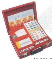
11-201-5 天和ケース入 ¥28,300