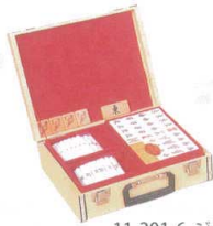
11-201-6 ジャンボバイケース入 ¥28,300