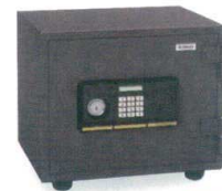
11-201-12K テンキー式 運賃 ¥54,000 (外寸:W416・D352・H364 内寸:W356・D220・H276 有効開口:W296・D220・H214) 質量:27kg 内容積:21.6ℓ 付属品:棚板1枚、単3形乾電池4本 ※この商品は30分耐火性能です。