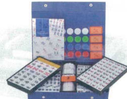
11-201-4 AMOSマーテル ¥10,100