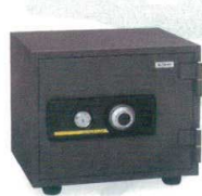
11-201-13K ダイヤル+シリンダー式 運賃 ¥35,000 (外寸:W416・D353・H364 内寸:W356・D220・H276 有効開口:W295・D220・H214) 質量:27kg 内容積:21.6ℓ 付属品:棚板1枚 ※この商品は30分耐火性能です。