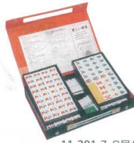
11-201-7 6号ケース入 ¥19,000