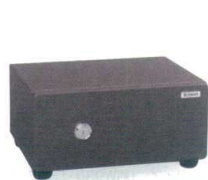
11-201-9K シリンダー式 運賃 ¥32,500 (外寸:W410・D346・H213 内寸:W330・D240・H105 有効開口:W330・D240・H105) 質量:20kg 内容積:8.3ℓ 付属品:トレー1枚 ※トレー内寸:W312・D222・H39 ※この商品は30分耐火性能です。

■ホテルや旅館でも安心していただけるプライベートボックスとして大活躍 ■マスターキー仕様は、1本の鍵で各部屋の金庫を管理できます