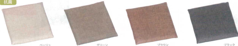
ベージュ グリーン ブラウン ブラック

RoHS 対応品 鉛・水銀・カドミウム・六価クロム・ポリ臭化ビフェニール、ポリ臭化ジフェニルエーテルを使用していない商品です。