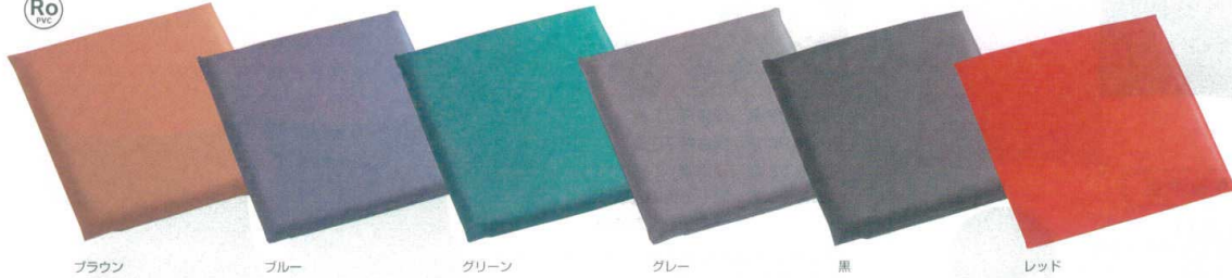
ブラウン ブルー グリーン グレー 黒 レッド

11-253-3 つや無し本皮調 中身(ウレタン)込 ¥5,100 (40×40×5)cm 11-253-4 つや無し本皮調 中身(ウレタン)込 ¥6,400 (50×50×5)cm 材質:裏地メリヤス ポリエステル65% レーヨン35% 色:ライトブラウン ブラウン ダークブラウン ダークグレー ブラック