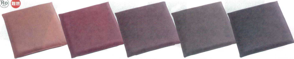
ライトブラウン ブラウン ダークブラウン ダークグレー ブラック

11-253-5 古皮調 中身(ウレタン)込 ¥5,400 (40×40×5)cm 11-253-6 古皮調 中身(ウレタン)込 ¥8,000 (50×50×5)cm 材質:裏地平織 ポリエステル65% コットン35% 色:ライトベージュ ライトブラウン(淡) ベージュ ブラウン ライトブラウン(濃) グレー グリーン ピンク ダークブラウン