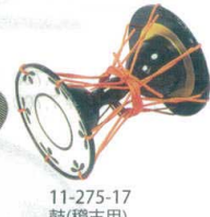
11-275-17 鼓(稽古用) ¥39,400 (巾25cm×20φ)