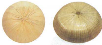
11-275-1 三度笠(すげ草) ¥12,600 (φ460)