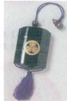
11-275-12 印籠 ¥3,500 (W75・D92) プラスチック