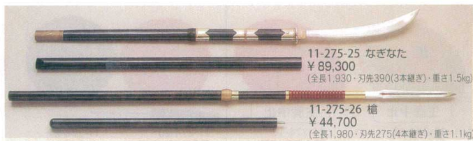
11-275-25 なぎなた ¥89,300 (全長1,930・刃先390(3本継ぎ)・重さ1.5kg)