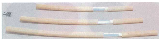
白鞘 11-275-22 ¥20,000 (全長600・刃先410・重さ295g) 11-275-23 ¥21,600 (全長760・刃先500・重さ310g) 11-275-24 ¥23,700 (全長900・刃先630・重さ460g)