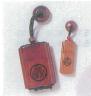
11-275-10 印籠 ¥4,200 (W70・H97) 木 11-275-11 印籠 ¥1,500 (W30・H73) 木