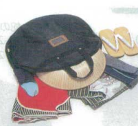
11-275-15 股旅衣裳かばんのみ ¥28,000