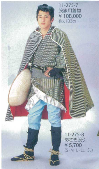
11-275-7 股旅用着物 ¥108,000 身丈133cm