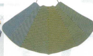
11-275-16 道中合羽 ¥11,100 (長さ870) レーヨン100%