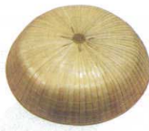
11-275-2 三度笠(小)(パーム) ¥3,000 (φ460)