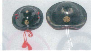
11-275-4 陣笠(子供用) ¥7,700 (約270φ・重さ200g) プラスチック 11-275-5 陣笠 ¥18,800 (約320φ・重さ530g) プラスチック