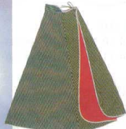
11-275-14 袷せ道中合羽 ¥21,000 (長さ1,100) 表:レーヨン100% 裏:アクリル100%