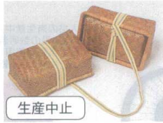
生産中止 11-275-3 振り分け荷物 ¥6,400 (W190・D120)