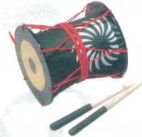
11-275-13 前太鼓(稽古用) ¥34,200 (巾18cm×18φ)