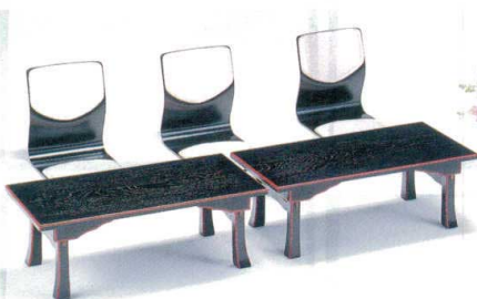
11-302-15 スリ黒ケヤキ面朱(折脚) [B] ¥44,000 (W450・D900・H325・天厚20)