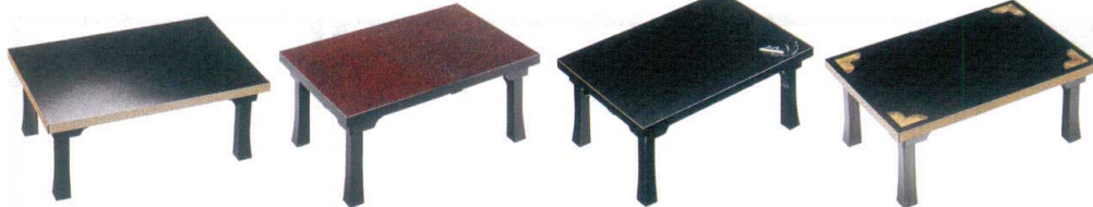
演漆膳 大和 黒タタキ洞アジロ [A] 11-302-6 底塗なし ¥15,300 (W720・D480・H320) 11-302-7 底・脚黒塗 ¥17,800 (W720・D480・H320)

天然FRP 脚ABS樹脂 FRPガラス繊維素材に特殊塗を加え、耐衝撃性抜群の強度を持つFRP天板シリーズ