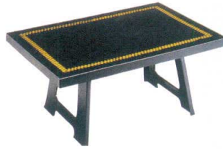
演漆膳 潮来 亀甲松葉黒タタキ [A] 11-302-2 セット ¥18,200 (W650・D500・H310)