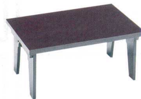
大和 膳ハードコーティング塗うるみ乾漆(折脚) [B] 11-302-17 ¥50,000 (W720・D480・H330)