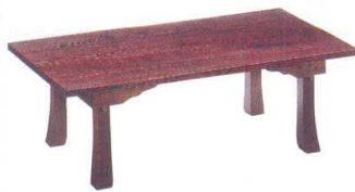
11-302-12 スリケヤキ ムク板(折脚) [B] ¥72,000 (W450・D900・H325・天厚20)