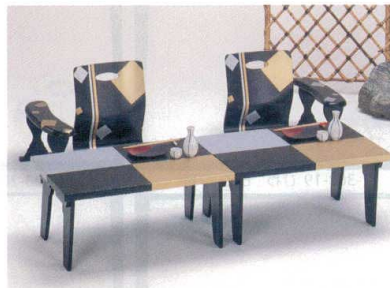
大和 膳ハードコーティング塗金/銀乾漆(折脚) [B] 11-302-16 ¥56,000 (W720・D480・H330)