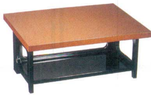
演漆膳 結城 梨地 [A] 11-302-4 ¥25,800 (W650・D500・H300)