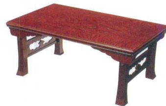
11-302-14 小机樫(折脚) ¥46,000 (W750・D450・H315) 重さ 約8kg 塗装 フレタン摺り仕上