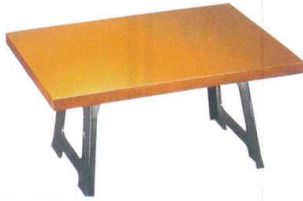
演漆膳 潮来 梨地塗 [A] 11-302-1 セット ¥18,100 (W650・D500・H310)