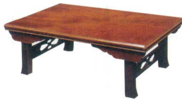
11-302-13 角ケリケヤキ(折脚) ¥56,000 (W900・D600・H335) 重さ 約11kg 塗装 フレタン摺り仕上