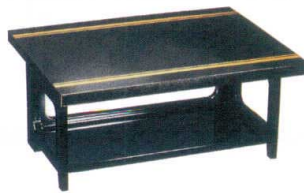
演漆膳 結城 黒タタキ金ライン [A] 11-302-5 ¥26,600 (W650・D500・H300)