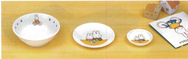
ラーメン鉢 11-316-1 ¥ 1,100 (W170・H57・700ml)