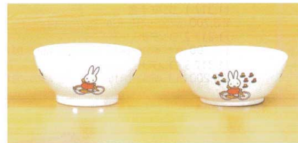
飯椀(身) 11-316-9 ¥ 730 (W108・H50・250ml)