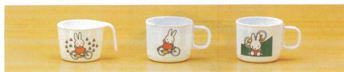
ミルクカップ 11-316-19 ¥ 700 (W80・H62・200ml)