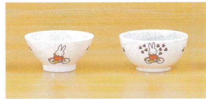
飯椀 11-316-4 ¥ 570 (W100・H50・175ml)