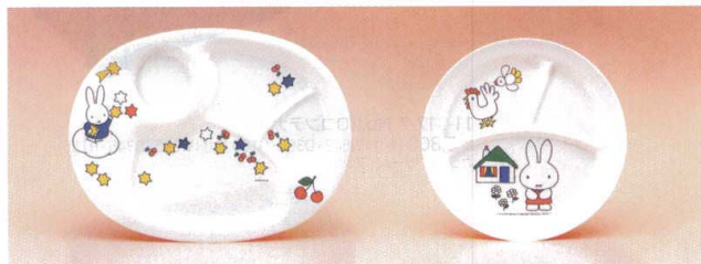
ランチ皿 11-316-11 ¥ 2,660 (W318・D242・H22)