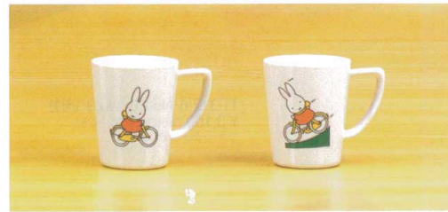
モーニングカップ 11-316-13 ¥ 980 (W73・H88・230ml)