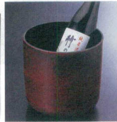
11-318-23 18cmワインクーラー 漆黒 ¥4,500 (φ180・H170)