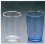
11-318-10 6オンスタンブラー ¥290 (W59・H84) (145cc)透明・ブルー 材質: アクリル