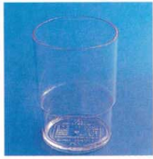
11-318-1 レギュラーカップ#94 ¥220 (φ68・H94) 入数: 240/ct・12ヶ箱入 容量: 250ml 材質: スチロール樹脂