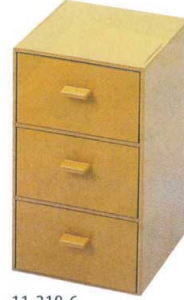
11-318-6 縦型ティーパック入 クリーム乾漆 ¥6,100 (W980・D990・H1,820)