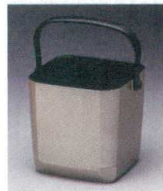
11-318-19 角アイスベール シルバーメタ ¥3,500 (W163・D163・H163)