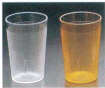
11-318-8 8オンスタンブラー(シボ付) ¥320 (W67・H101) (240cc)透明・オレンジ 材質: アクリル