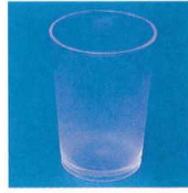
11-318-5 ユーゴンコップ ¥1,950 (φ61・H97) 入数: 50ダース/ct・12ヶ箱入 容量: 160ml 材質: スチロール樹脂