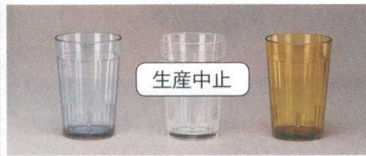
11-318-17 14オンスタンブラー ¥1,150 (W82・H121) (415ml) ブルー・クリア・セピア 材質: COP