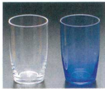
11-318-9 8オンスタンブラー ¥390 (W63・H98) (210cc)透明・ブルー 材質: アクリル