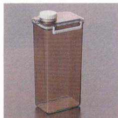
11-318-25 メロディーピッチャー1.8 ¥1,400 (W133・D102・H270) ●容量: 1.8ℓ ●材質: (本体・フタ)AS (止め具)ポリプロピレン (栓)ポリプロピレン (パッキン)シリコン