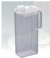
11-318-26 クールベール ¥1,700 (W170・D102・H270) ●入数: 36/ct・12ディスプレイボックス ●容量: 1.9ℓ ●材質: (本体・フタ)メタクリル樹脂 (止め具)ポリプロピレン (栓)ポリプロピレン (パッキン)シリコン ●パッケージサイズ: W555・D460・H300