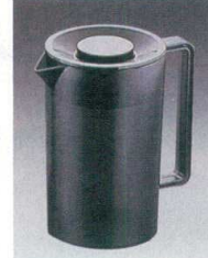
11-318-28 ジュニアピッチャー ブラック ¥4,700 (φ130・H214)(2.2ℓ)