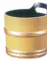
11-318-24 手桶型ワインクーラー 白木塗 ¥3,400 (φ160・H150)