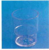
11-318-3 レギュラーカップ#82 ¥190 (φ68・H82) 入数: 240/ct・12ヶ箱入 容量: 210ml 材質: スチロール樹脂