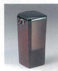
11-318-29 角ウォーターポット 溜 ¥3,300 (W108・D95・H215)