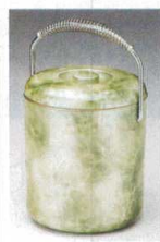
11-318-21 クールアイスベール グリーン大理石 ¥2,800 (φ135・H155)