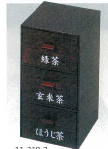
11-318-7 縦型ティーパック入 チーク ¥6,500 (W980・D990・H1,820) 名前は別料金