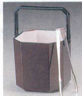
11-318-20 スナック角アイスベール 溜(トング付) ¥2,500 (W132・D132・H136)