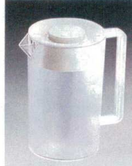
11-318-27 ジュニアピッチャー グレー ¥4,700 (φ130・H214)(2.2ℓ)