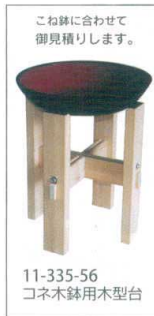
こね鉢に合わせて 御見積りします。

11-335-54 めん定規(大) ¥ 5,050 (W300・D240・H45) 11-335-55 めん定規(小) ¥ 3,050 (W240・D150・H45)