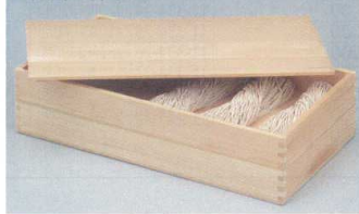
生船箱(白木)身・蓋

11-335-38 ¥ 12,000 (W540・D290・H65) 11-335-39 ¥ 5,200 (W540・D290・H15)