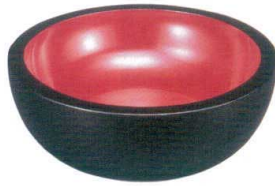
うるし塗コネ鉢(木製) 外黒内朱塗

11-335-15 ¥ 25,400 (300φ・H105) 11-335-16 ¥ 34,500 (330φ・H105) 11-335-17 ¥ 45,400 (360φ・H105) 11-335-18 ¥ 58,000 (390φ・H105) 11-335-19 ¥ 72,500 (420φ・H120) 11-335-20 別途見積り (450φ・H120) 11-335-21 別途見積り (480φ・H120) 11-335-22 別途見積り (540φ・H170) 11-335-23 別途見積り (600φ・H190) 11-335-24 別途見積り (660φ・H190)