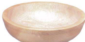
コネ鉢木地(栓)(外側ウレタン)

11-335-15 ¥ 25,400 (300φ・H105) 11-335-16 ¥ 34,500 (330φ・H105) 11-335-17 ¥ 45,400 (360φ・H105) 11-335-18 ¥ 58,000 (390φ・H105) 11-335-19 ¥ 72,500 (420φ・H120) 11-335-20 別途見積り (450φ・H120) 11-335-21 別途見積り (480φ・H120) 11-335-22 別途見積り (540φ・H170) 11-335-23 別途見積り (600φ・H190) 11-335-24 別途見積り (660φ・H190)