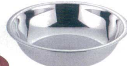
ステンレスごね鉢

11-335-32 12.0寸 ¥ 15,000 (φ360・H95) 11-335-33 15.0寸 ¥ 26,100 (φ455・H116)