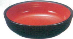
厚口 新ごね鉢 内朱天黒 ユリアメラミン

11-335-9 9寸 ¥ 2,100 (φ263・H83) 11-335-10 尺0.5寸 ¥ 3,900 (φ311・H83) 11-335-11 尺2寸 ¥ 5,400 (φ360・H96) 11-335-12 尺4寸 ¥ 9,100 (φ415・H110) 11-335-13 尺6寸 ¥ 13,700 (φ480・H125)